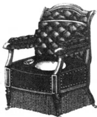
Slika 4. Sobno stranišče kot udoben naslanjač