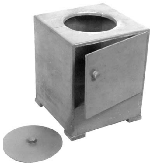
Slika 7. Omarica za nočno posodo s pokrovom

od katerih sta še dve uporabni in služita 80 možem neke transportne enote in pa delovnemu oddelku vojnih ujetnikov, ki šteje 187 ujetnikov in 22 stražarjev. /.../ V normalnih pogojih se računa 20 ljudi na tovrstno stranišče. Stranišča se ne praznijo, tako da podgane po kupih iztrebkov brez težav pridejo v bivalni prostor, tem lažje, ker stranišče nima vrat." Dr. Bleiweis je bil zato mnenja, da je treba hišo nujno zapreti in zapečatiti. 43