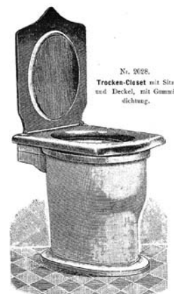
Slika 6. Suho stranišče

Greznici moramo dodati tudi posebno cev, ki naj bo speljana do strehe in bo omogočala odvajanje smrdljivih plinov, ki bi se sicer lahko nevarno kopičili v greznici.” 31