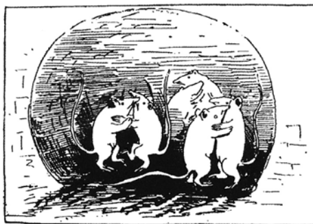
ko so začule vest, da nove kanalizacije še ne bodo tako hitro.