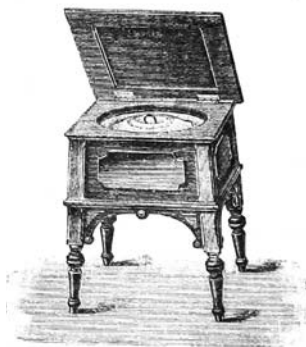
Slika 2. Sobno stranišče

takšni hiši, pa potreba ga sili, de odrine. Že poti okoli takih vasi, kjer vstraniš ni, so večkrat take, de ni izreči.” 7