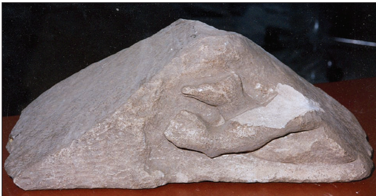
Slika 1. Ullomak zabata s dijelom kompozicije reljefnoga prikaza Genija (foto: Perica Mihaljević, 1999).

Figure 1. Fragment of the pediment with part of a composition relief portraying Genius (photo: Perica Mihaljević, 1999).