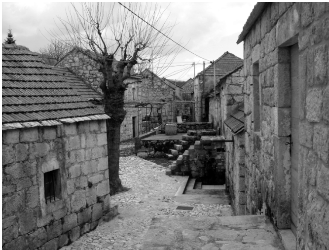
Etno-selo, Veliki Gdinj, Dalmacija (izvor: Konzervatorski odjel u Splitu, 2007.)

canja obnove raseljenih i zapuštenih sela Etno-eko“ radi proširenja turističke ponude. Program podrazumijeva očuvanje kulturne baštine; obnovu starih kuća, gospodarskih objekata, zadružnih domova, škola, crkava, kapela i ostalih objekata; obnovu postojećih infrastrukturnih objekata te izgradnju novih; zaustavljanje raseljavanja (demografske erozije); povratak domicilnog stanovništva u navedena naselja; promociju dalmatinskog turizma u nas i u svijetu; komercijalizaciju obnovljenih smještajnih i ugostiteljskih kapaciteta (seoski turizam); oživljavanje tradicijske proizvodnje i starih obrta; proizvodnju zdrave hrane; napokon, poticanje i zaštitu tradicijskih proizvoda otoka i Dalmatinske zagore (Stella 2008). Od te inicijalne 2005. godine naovamo, Splitsko-dalmatinska županija svake je godine objavljivala javni poziv za prijavu potencijalnih “Etno-eko“ sela za dodjelu bespovratnih sredstava, tako da je tim Programom obuhvaćeno 33 naselja, odnosno etno-sela . 10 Njih nekoliko, poput Gornje Podstrane, Murvice, Humca na Hvaru i Malog Grablja, trenutno su u visokom stupnju realizacije, što znači da su na tim područjima organizirani mali restorani, osiguran smještaj turista, a organiziraju se i izleti. Nositelji programa su lokalne udruge ili lokalna samouprava, a prate ga izrada geodetske podloge, konzervatorskog elaborata i urbanističkog plana.