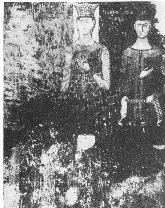
Psarades. Sebastokrator Vlatko, sebastokratorica Vladislava, Stefan, sin sebastokratorov