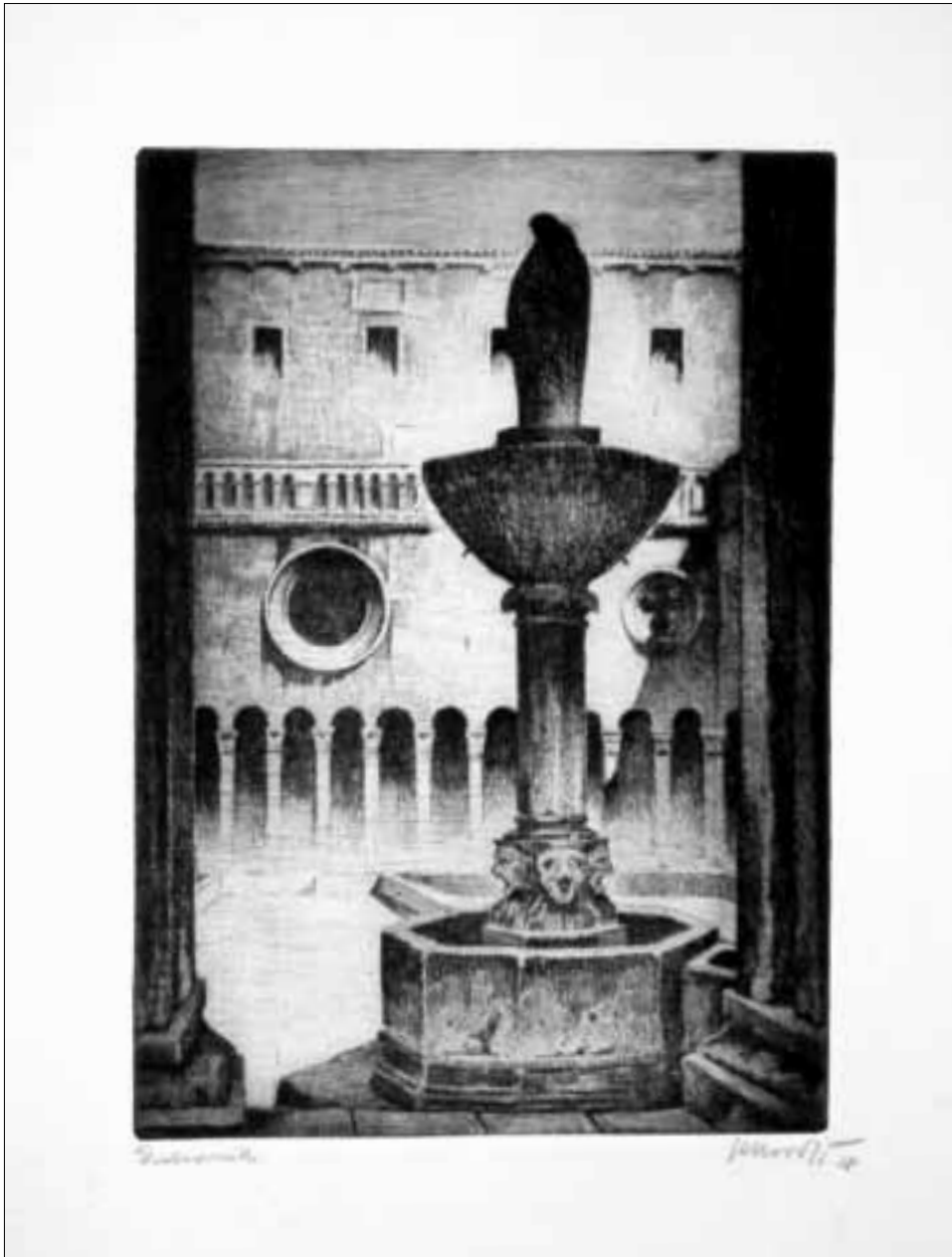
Angjeo Uvodić, Dubrovnik, 1928., bakropis, suha igla / karton, mapa Dalmacija, Muzej grada Splita