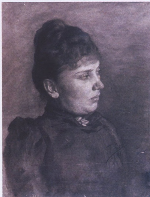
Ivan Tišov, Portret gospode, crtež ugljen, 56x41