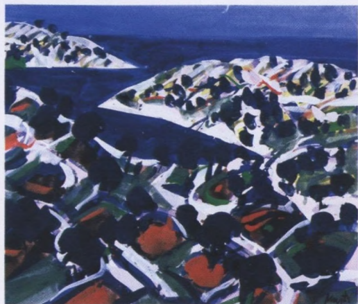
Edo Murtić, Uvala, gvaš, 48x68,5