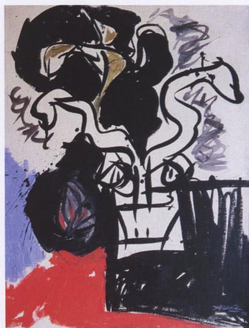
Dalibor Jelavić, Mali vrač, 1990., ulje na platnu, 65x50