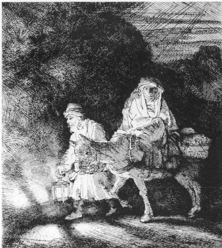
Rembrandt, Bijeg u Egipat, bakrorez, 130x110

Ova metodička postava, iako s naglašenim geografskim naznakama, ima i svoje temeljno određenje: postojanost i shvaćanje univerzalnog likovnog govora, bez obzira na zemljopisnu, povijesnu, političku, rasnu, vjersku ili bilo koju drugu pripadnost. Upravo tim i takvim jezikom Ivan Lacković Croata često je govorio: ... Umjetnost mora imati univerzalnost po svom govoru, usudio bih se reći po osjećaju. Jer te male umjetnosti, ako ostanu lokalne, one moraju imati korijen u etnosu iz kojeg izlaze jer ako to izgube – rasprostranjenost univerzalnog znaka šteti umjetnosti – svaka umjetnost donosi nešto svoje, ne u onom negativnom folklornom smislu, ona uvijek dolazi iz nečega. "