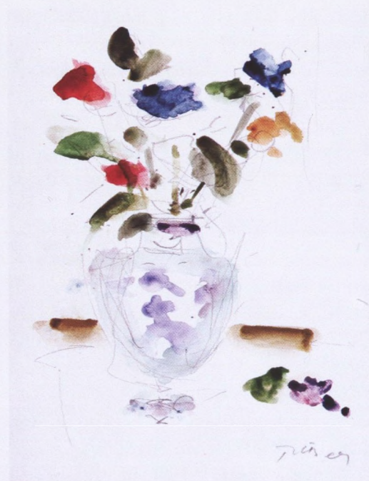
Nikola Reiser, Cvijeće, olovka akvarel, 41x29