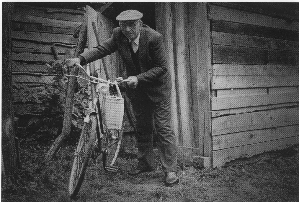
Ivan Generalić, doajen hlebinskog naivnog slikarstva u jesen 1985.