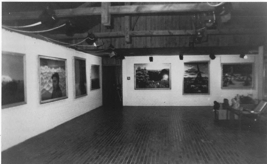
Stalni postav Zbirke Generalić u Galeriji Hlebine