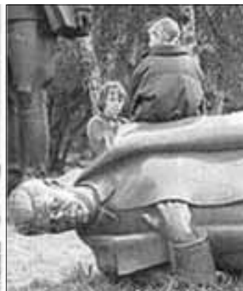
Veliki vladari - Kim il Sung, Mao Ce Tung i Staljin