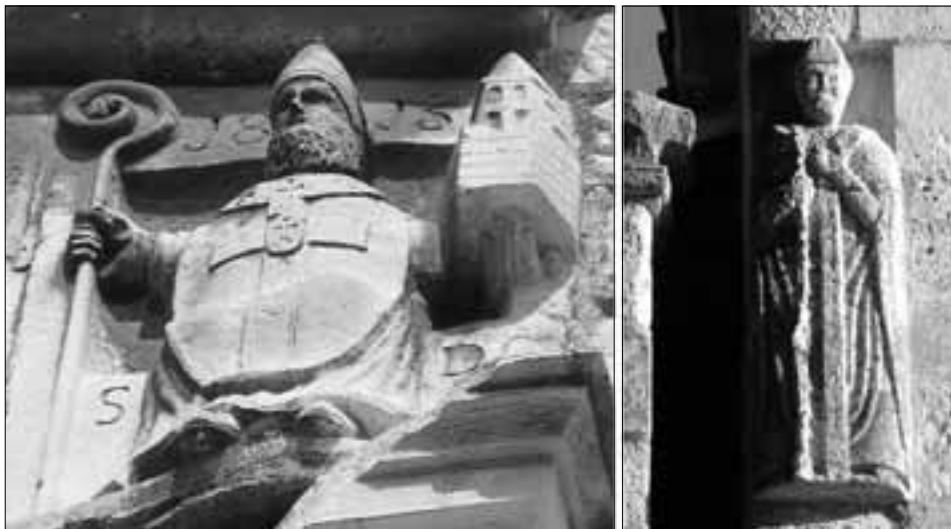
Sveti Duje na kuću na Obrov (1815.) i na Susutipanu (13. vijek)