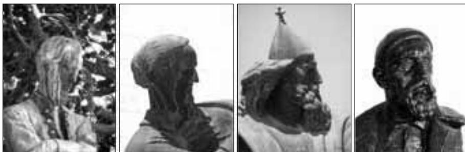
4 spliska Meštrovićeva portreta: - Botić (1901.), Marulić (1925.), Grgur (1929.) i autoportret (1936.)