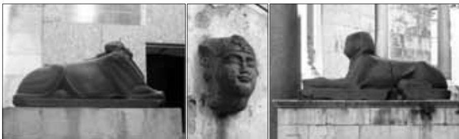
Tri sfinge unutar palače: bezglava čuva mali bram, crvenoglava je u Dominisovu kalu (jeli ono njezino tilo doli u Podrume?), a ciknuta leži na Peristil