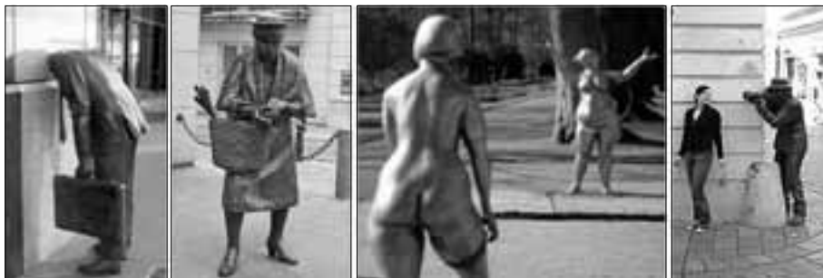
Javna skulptura kao dil urbane opreme postaje ukras, dosjekta, foto suvenir