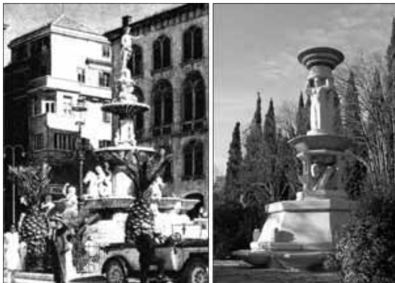
Slučajna sličnost prostorne kompozicije bivše Česme Franje Josipa I (1888.), i "Sunčane Dalmacije" (1989.)?