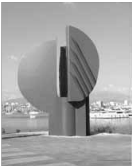
Jagoda Buić (1987.)