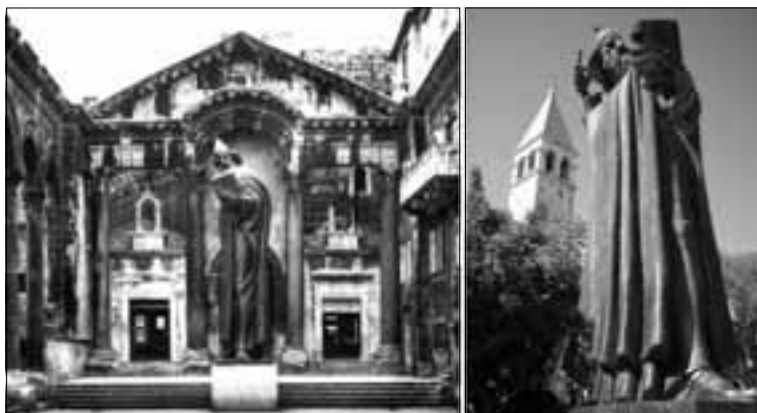
Kad si velik, uvijek ti je tisko...