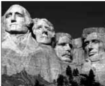
Kip slobode - New York, Isus Krist - Rio i Mount Rushmore - Južna Dakota