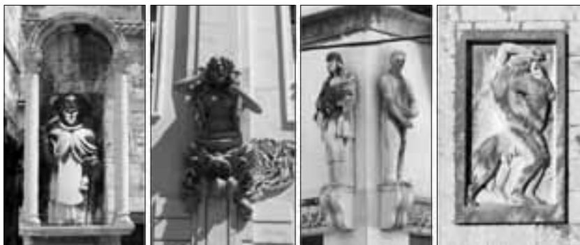
Sveti Ante Opat (1394.), sumporno kupalište (1903.), Radio centar (1933.) i Gimnazija (1940.)