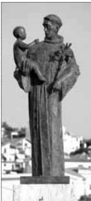
Spliski graničnici: Isus-Krst, spasitelj svieta u Solimu (1900.) i Sveti Ante Padovanski u Podstranu (2006.)