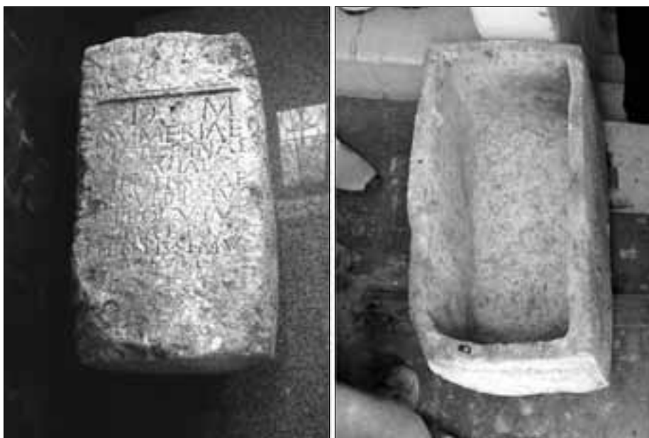
Rimski nadgrobni spomenik Numeriae Victorinae (Samostan Majke Divne) kasnije priklesan u kamenicu