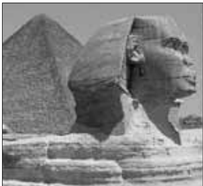
Velika sfinga u Gizehu