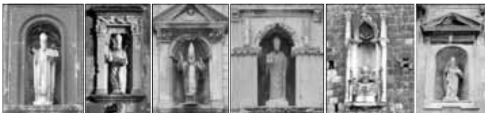
Gospari su ne sramidu svoga patrona, Svetega Vlahe