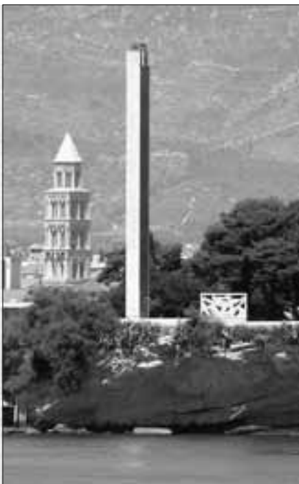
Kompozicija "Spomenik pomorcu" A. Krstulović i I. Carić