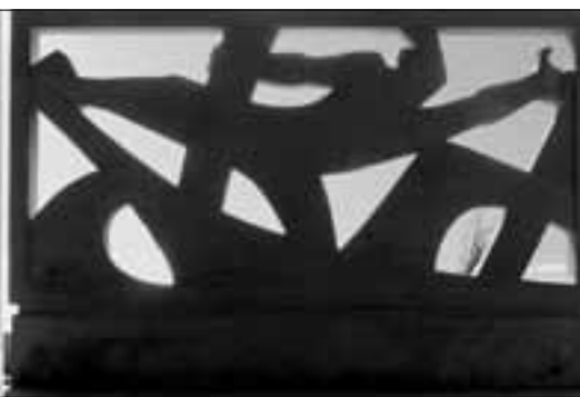
Andrija Krstulović, od realizma do stilizacije:

Spomen ploča spliskim borcima palim za slobodu 1941.-1945. - poginulim veslačima Gusara na fasadi "Gusarevoga doma" (1945.)