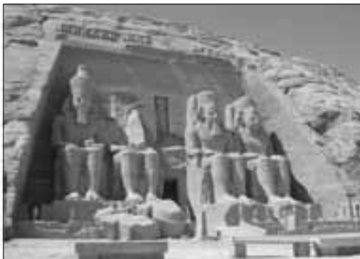
Hram Abu Simbel kod Asuana