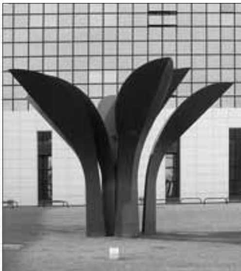
Vasko Lipovac (2006.)