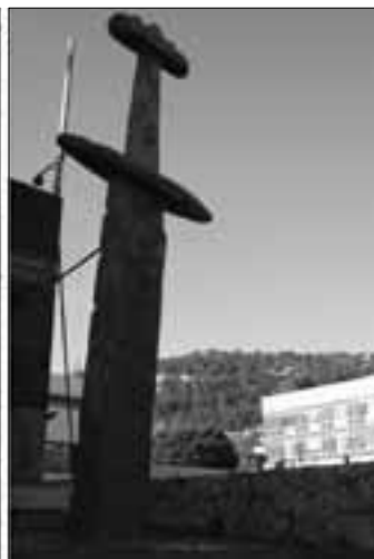
i mač Velikega Karla isprid MHAŠ (2000.)