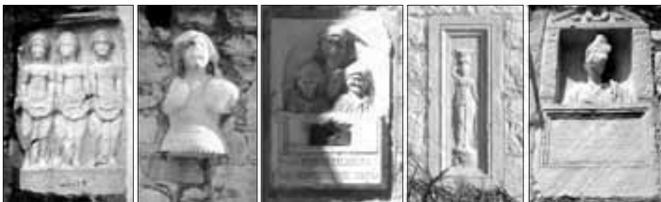
Kameni fragmenti na fasadame kuća u Duplančića dvore,