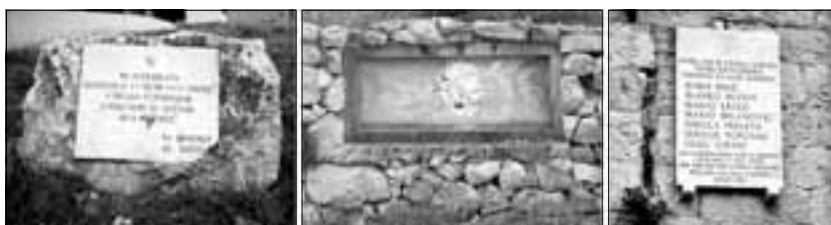
Praksa žalost demantira pisnika koji piva:- ko na tvrdoj stini svoju povist piše, tom ne može niko prošlost da izbriše...