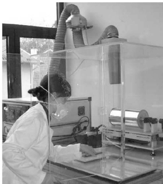
Slika 4. Osobna zaštitna oprema djelatnika za vrijeme aktivacije uređaja za elektropredenje

minimalan broj izloženih radnika u laboratoriju. Slika 4. prikazuje osobnu zaštitnu opremu radnika u laboratoriju za vrijeme aktivacije uređaja za elektropredenje.