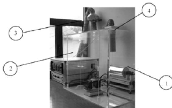
Slika 3. Zaštitna oprema uređaja za elektrospredenje