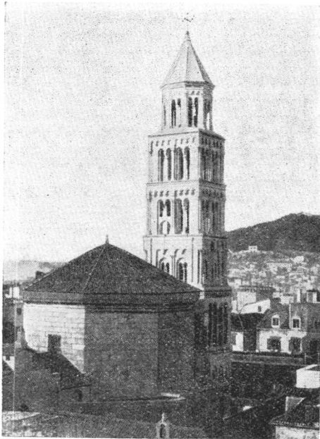
Mauzolej cara Dioklecijana (splitska katedrala) sa zvonikom