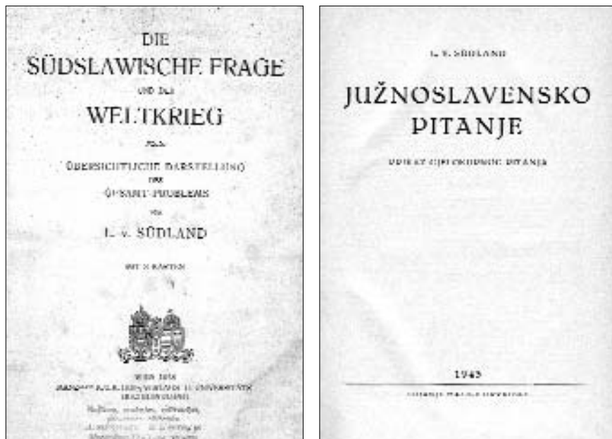
»Bečko« izdanje iz 1918. godine i hrvatski prijevod Ferde Puceka iz 1943.

starijih tekstova, trebalo tiskati u bilješkama ispod osnovnog teksta, nego na kraju svakoga poglavlja (ili na kraju knjige, što valja prepustiti uredničkoj odluci). Tek na taj će način novo izdanje zadovoljiti i visoke kriterije »kritičkog izdanja« (prevažnog za struku) i biti pristupačno širokom krugu zainteresirane kulturne javnosti.