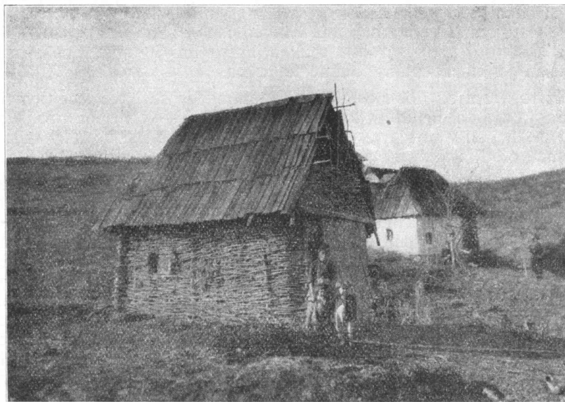
Jedna nedovršena, ali nastanjena, „kuća“ na Hrasnicama.

Sada Cigani većinom žive u vrlo bednim raštrkanim kućicama, pletenim od pruća i oblepljenim blatom, kojima se od smrada ne može prići. Po tipu te su kuće iste kao i kod ostalih seljaka: tj. dvodelna prizemna kuća, ali manjih dimenzija. U takvim kućama žive Cigani u Malom Čajnu i na Vranjku, kod kojih ima već i lepih krečenih kuća. Na Vranjku su nekolicke kuće od ćerpiča. To su baro ćer , velika kuća, t.j. obična kuća. Većina pak živi u malim kućicama od plota i kala, koje su široke do dva a dugačke tri do četiri metra. Grade se tako da se pobodu kolje ili jači