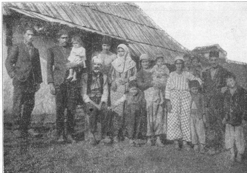
Jedna grupa Cigana s Hrasnica.