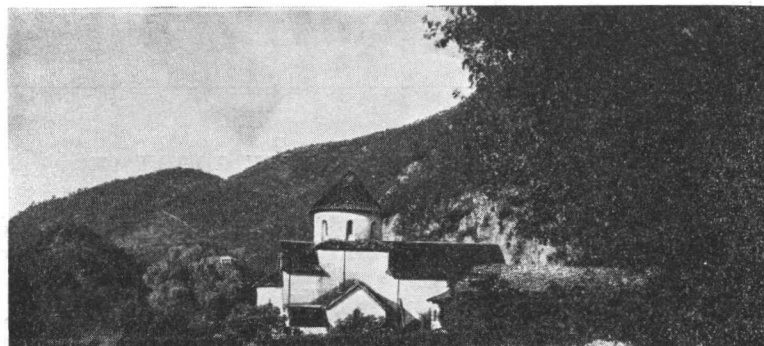
Manastir Morača. Pogled sa severa.*

Naročitu pažnju privlače mnogobrojni umetničko-obrtni predmeti u ovoj crkvi. Pošto je ona sagrađena na jednom teško pristupačnom mestu, koje je bilo u Srednjem veku sasvim zapušteno, tu su se čuvali stari rukopisi od različitih nedaća, koje su drugim manastirima naneli vreme i najezde