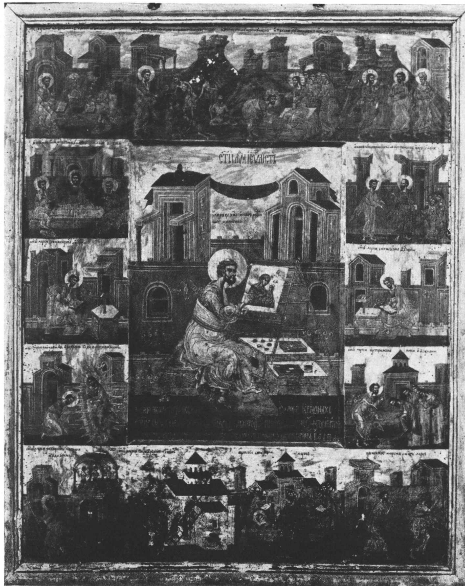
Ikona Sv. Luke. Manastir Morača.

»Narodna Starina« sv. 28. (Dr. F. Mesesnel, Manastir Morača).