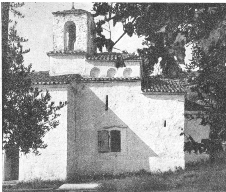
Izgled crkve sv. Gjorgja u Podgorici 1929. godine.

Postoji jedana velikia srodnost između starohrvatske i starosrpske srednjevekovne arhitekture. Uticaj Primorja je bio vrlo veliki