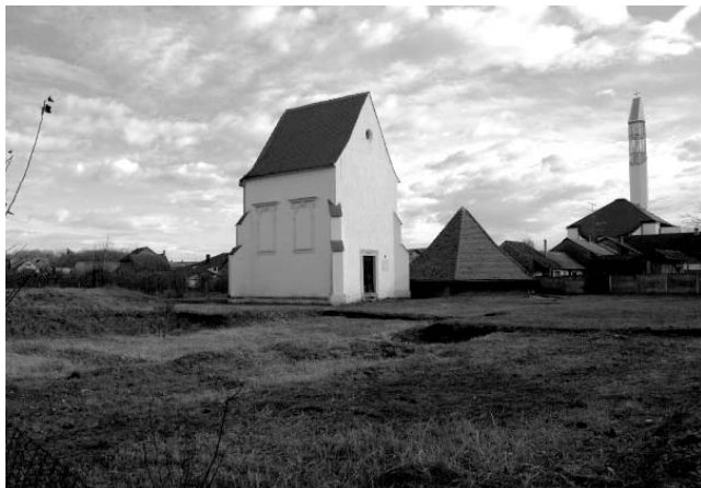
Šenkovec, samostan Blažene Djevice Marije i svih svetih. Pogled na kapelu sv. Jelene (bivše svetište samostanske crkve). Foto: M. Korunek, 2010.

bio organiziran oko pravokutna klaustra. 62 Cjelovito određivanje tlocrtnog rasporeda samostanskog sklopa bilo bi moguće tek nakon opsežnih revizijskih istraživanja.