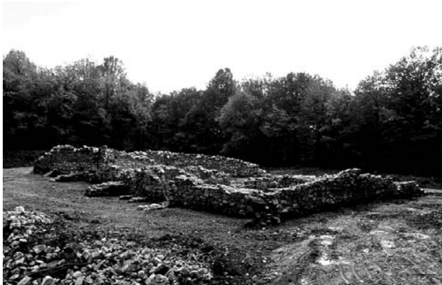
Zlat (Petrovac), samostan sv. Petra. Pogled na istraženi samostanski sklop sa sjeveroistoka.