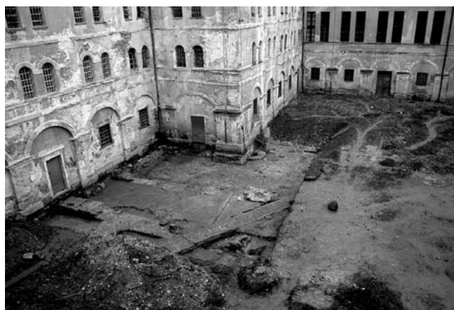
Lepoglava, samostan Blažene Djevice Marije. Pogled sa sjeveroistoka na kasnorednjovjekovni klaustar.

Brojnim novovjekovnim i suvremenim građevinskim intervencijama nepovratno su uništeni ključni podatci bez kojih pravilno razumijevanje i rekonstruiranje srednjovjekovnoga lepoglavskog samostanskog sklopa nikada ne će biti potpuno.