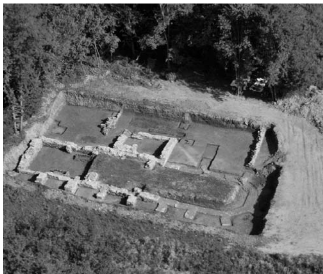
Streza (Pavlin Kloštar), samostan svih svetih. Pogled iz zraka na samostanski sklop nakon arheoloških istraživanja 2010. godine. Foto: J. Kliska, 2010.

mogradski Stjepan II. Lacković i magistar Stjepan, vrhovni ugarski konjušnik. 55 Samostan je osnovan u vrijeme generala Reda Petra IV. na posjedu Šenkovec nedaleko od Čakovca, u plodnoj međimurskoj dolini. Šenkovečki redovnici proširili su darovnicama svoje posjede tijekom prvih dvjesto godina od osnutka samostana. 56 Očito je kako su redovnici imali izvrsne odnose s okolnim plemićima jer tijekom ta prva dva stoljeća postojanja samostana nije zabilježen ni jedan sudski spor. 57