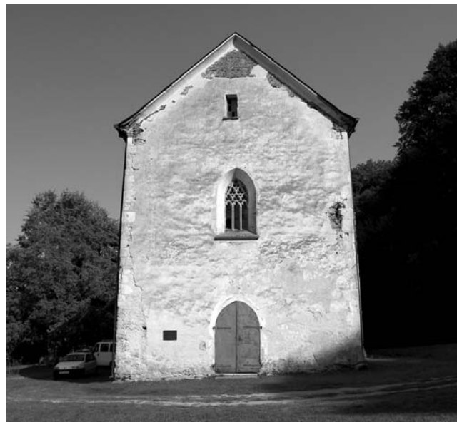
Donja Vrijeska, samostan sv. Ane. Zapadno pročelje samostanske crkve.

O najmlađemu kasnosrednjovjekovnom pavlinskom samostanu u srednjovjekovnoj Slavoniji ne može se mnogo reći. Prema zatečenoj situaciji može se samo pretpostaviti kako je sklop bio pravokutna oblika, određen s jugoistočne strane samostanskom crkvom. Najvjerojatnije su samostanska krila, u skladu s komparativnim primjerima drugih slavonskih pavlinskih samostana, zatvarala pravokutni ili kvadratni klaustar. Crkva sv. Ane izgrađena je u skladu s tlocrtnim rješenjima drugih samostanskih crkava Pavlinskog reda. Njena longitudinalnost naglašena je podjednakim dimenzijama pravokutne, jednobrodne lađe i poligonalno zaključena svetišta. Na slobodnim pročeljima bila je crkva sv. Ane ojačana pravokutnim kontraforima. Kako su arheološka istraživanja najmlađega slavonskog kasnosrednjovjekovnog samostanskog sklopa tek počela, 86 za neke nove zaključke trebat će pričekati rezultate daljnjih istraživanja na slobodnim prostorima oko postojećega manastirskog zdanja.