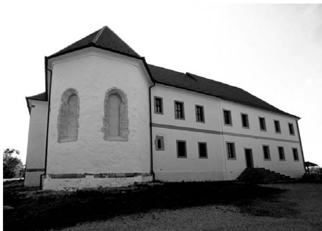
Kamensko, samostan Blažene Djevice Marije Snježne. Pogled na začelni zid samostanske crkve. Foto: N. Vasić, 2009.

stan je uništen tijekom osmanlijske okupacije nakon nešto više od stoljeća od osnutka, u vremenu između 1537. i 1542. godine. 84