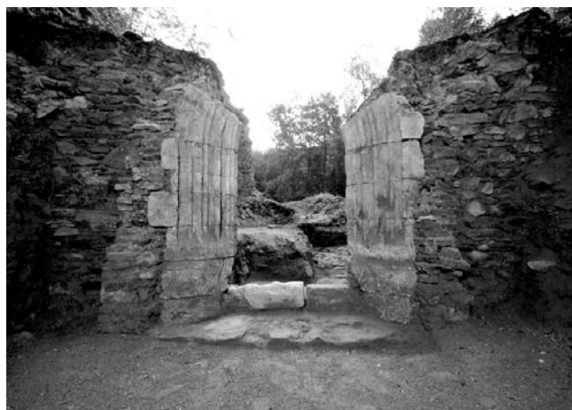
Moslavačka gora, samostan Blažene Djevice Marije. Za-padno pročelje samostanske crkve Navještenja Marijina. Foto: J. Kliska, 2010.

opeke. Kako istraživanja traju tek dvije sezone, za sada još ništa nije moguće reći o tlocrtnom rasporedu samostanskog sklopa.