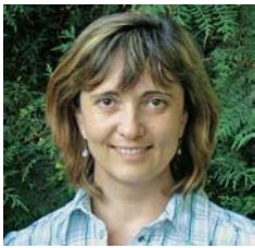
Priredila: Maja RUJNIĆ-SOKELE

Desetljećima se činilo da ima napretek izvora energije za ljude i gospodarstvo. Energija je bila relativno jeftina pa iako je potrošnja po stanovniku sve više rasla, to nikoga nije previše zabrinjavalo. Svjetske potrebe za resursima energije, međutim, sve više rastu, zbog kontinuiranog porasta potreba visokorazvijenih zapadnih zemalja, ali i zbog sve većih potreba zemalja koje sve ubrzanije razvijaju svoja gospodarstva poput Indije i Kine, ali i Rusije, Brazila i Južne Afrike (BRICS).