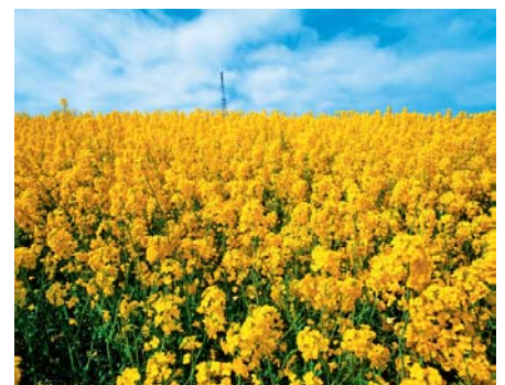
SLIKA 1 – Polje uljane repice 13

gorivima: količina biogoriva koja se može proizvesti nije ograničena, za razliku od fosilnih goriva koja će se prije ili poslije iscrpiti, te činjenica da je ukupni ugljikov trag biogoriva gotovo jednak nuli zbog zatvorenog ugljikova kruga. Zatvoreni ugljikov ciklus znači da biljke koje se koriste za proizvodnju biogoriva iz atmosfere uzimaju ugljikov dioksid i vraćaju kisik u postupku fotosinteze, a kasnijim izgaranjem biogoriva iz atmosfere se uzima kisik i ispušta se ugljikov dioksid. Time se ne povećava ukupna količina ugljikova dioksida u atmosferi, za razliku od otvorenog ugljikova ciklusa fosilnih goriva u kojemu se ugljikov dioksid samo ispušta u atmosferu, a nikad se iz nje ne uzima. 11 U prvu generaciju biogoriva (tablica 1), 6 koja se odnosi na proizvodnju konvencionalnim postupcima od šećerne trske, uljane repice, biljnog ulja i životinjskih masnoća, ubrajaju se bioetanol i biodizel, te bioplina. Bioetanol prve generacije je alkohol proizveden od biomase i/ili biorazgradljive frakcije otpada, a koristi se kao biogorivo. Najvažniji materijali za proizvodnju bioetanola su: šećerna trska, šećerna repa, kukuruz, pšenica, sirak i krumpir. Biodizelsko gorivo po strukturi je metilni ester proizveden od ulja uljarica ili masti životinjskog podrijetla, kvalitete mineralnoga dizelskoga goriva. Za proizvodnju biodizelskoga goriva najvažniji su uljana repica (slika 1), suncokret, soja, palma, otpadno jestivo ulje i goveđi loj. 12