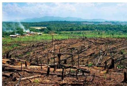
SLIKA 4 – Paljenje tropskih šuma zbog plantaža palmi uljarica 25

Najdrastičniji primjer uništavanja okoliša je proizvodnja palmine ulja u jugoistočnoj Aziji koje se rabi za proizvodnju biodizela. U Maleziji i Indoneziji proteklih je godina spaljeno na tisuće četvornih kilometara tropskih šuma zbog plantaža namijenjenih proizvodnji palmine ulja (slika 4). To je posebice katastrofalno jer se često pale i šume koje su na tresetnom tlu, čime se u atmosferu oslobađaju goleme količine stakleničkih plinova. Samo na Sumatri krčenje šuma na tresetnom tlu, prema podatcima WWF -a (e. World Wide Fund for Nature ), u razdoblju između 1990. i 2002. godišnje je prouzrokovalo oko 1,1 gigatonu emisija ugljikova dioksida, što je više nego što cijela Njemačka godišnje emitira stakleničkih plinova. 24