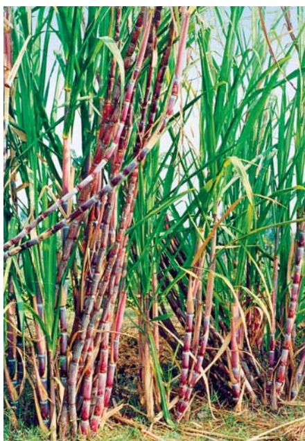
SLIKA 2 – Šećerna trska 17

je zimi dopušten tlak para do 90 kPa, ljeti je on ograničen na 60 kPa. Zimski E10 smije se prodavati do 30. travnja; nakon toga na crpkama smije biti samo ljetni E10 . Političari optužuju naftne koncerne da su nevoljko pristali na prodaju biogoriva, tako da je za čitav kaos kriva i činjenica da je malo koji vozač pravodobno saznao podnosi li njegov automobil benzin pomiješan s tako mnogo alkohola, niti su koncerni na bilo koji drugi način istaknuli prednosti goriva E10 . 18