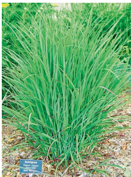
SLIKA 5 – Proso trava 26

zemljišta, a to povećava potražnju za takvim zemljištem i diže cijenu, pretvaranje hrane u gorivo ne čini se logičnim izborom rješavanja svjetskih energetske problema. Uzevši sve to u obzir, istraživači su se preusmjerili na pronalaženje novih procesa proizvodnje biogoriva od biljaka koje nemaju nikakvu vrijednost na tržištu hrane. Istraživanja proizvodnje biogoriva u SAD-u trenutačno su koncentrirana na proso (lat. Panicum virgatum , e. switchgrass ), travu toplih godišnjih doba koja se prirodno pojavljuje od Kanade preko SAD-a do Meksika (slika 5). Glavne prednosti prosa su iznimno brz rast u gotovo svim klimatskim prilikama i to što ne zahtijeva osobito plodna tla koja su potrebna za ostale poljoprivredne kulture. Unatoč tim važnim prednostima još ostaje pitanje gdje će se ta trava uzgajati, s obzirom na to da će biti potrebne velike površine da bi se zadovoljio velik udio biogoriva u svjetskim razmjerima. Stoga su ekolozi zabrinuti da bi se mogla pokrenuti velika kampanja deforestacije radi oslobađanja dovoljnog prostora za sadnju prosa trave. 11