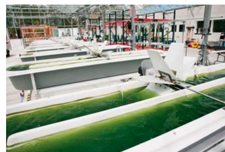
SLIKA 6 – Uzgoj algi za proizvodnju biogoriva 28

u Virginiji 29 pokazala da proizvodnja algi troši više energije, ispušta više emisija stakleničkih plinova i zahtijeva više vode od ostalih izvora biogoriva kao što su kukuruz, proso, trava ili kanola. S gledišta životnog ciklusa, alge nisu baš tako poželjne kako se na prvi pogled čini, a glavni su krivac umjetna gnojiva. Uzgajanje algi u otvorenim umjetnim jezerima slično je proizvodnji u plitkim bazenima pa tako svi nutrijenti (dušik i fosfor) koji trebaju održavati alge na životu i potpomagati njihov rast dolaze iz vanjskih izvora. Kada se uzgaja kukuruz, najčešće se izmjenjuje sa sojom kako bi se fiksirao dušik.* Gnojidba je i dalje nužna, no u slučaju uzgajanja algi potrebe za gnojivom mnogo su veće. I ugljikov dioksid pridonosi ekološkom tragu algi. Alge se koriste Sunčevom svjetlošću i vodom kako bi pretvorile ugljikov dioksid u materijale koji se mogu jednostavno pretvoriti u gorivo. No taj ugljikov dioksid odnekuda mora doći, najčešće, kao i gnojiva, iz fosilnih izvora. Osim toga proizvodnja algi ima i druge negativne učinke. Kako bi alge pretvorile u gorivo, proizvođači centrifugiraju vodu s algama kako bi ih razdvojili, a za to su također potrebne velike količine energije.