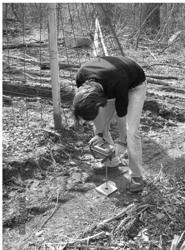
Slika 3. Mjerenje osovinskoga opterećenja vozila i konusnoga indeksa Fig. 3 Measuring of vehicle axle load and cone index