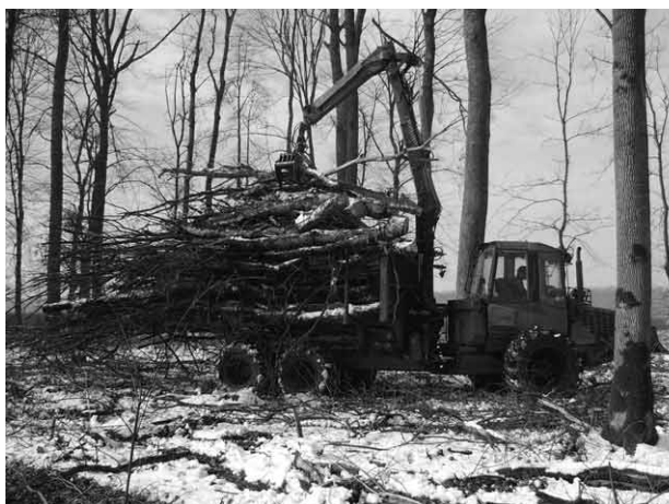
Slika 1. Transport i iveranje energijskoga drva Fig. 1 Transport and chipping of wood for energy