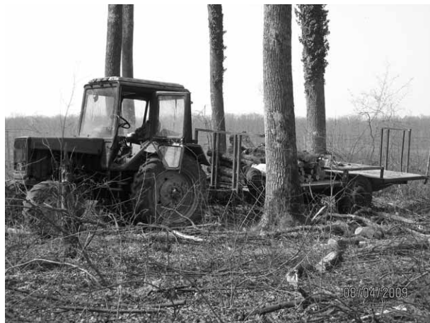
Slika 2. Prijevoz jednometarskoga ogrjevnoga drva traktorskom ekipažom

2. metoda: Krajem ožujka i početkom travnja, nakon rušenja stabala, izrađena je tehnička oblovina i višemetarsko drvo koji su zajedno voženi forvarderom na pomoćno stovarište. U sljedećem je koraku, angažiranjem privatnoga poduzetnika, izrađeno jednometarsko ogrjevno drvo koje je voženo traktorskom ekipažom, kako pokazuje slika 2. U trećem je