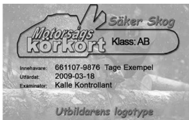
Slika 1. Izgled dozvole/licencije za rad s pilom (oznake AB odnose se na razinu/kategoriju dozvole; A je izrada oborenoga stabla, a B je rušenje stabla)

Fig. 1 Appearance of the permit/license to work with the chainsaw (letters AB designate the level/category of the license; A stands for processing a fallen tree, and B stands for felling of trees)