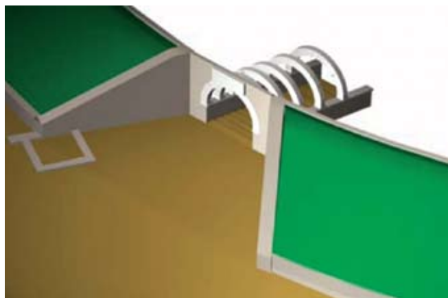
Trodimenzijski prikaz južnog prolaza amfiteatra u Burnumu

Nemamo zasad nikakvih vijesti o imenima arhitekata koji su projektirali i po čijim su idejama i zamislima dali sagraditi ovu monumentalnu građevinu. Na građevini možemo razlikovati dvije ustanovljene građevinske faze, mada još nije pouzdano utvrđeno je li bilo i nekih kasnijih, koje bi trebalo relativno-kronološki opreznije datirati. Prvu građevinsku fazu možemo vremenski atribuirati u vrijeme cara Klaudija, dok završnu građevinsku fazu amfiteatra u Burnumu možemo smjestiti u vrijeme vladavine cara Vespazijana, koji je ujedno novčano i pomogao njezino dovršenje. 30 Radove koje je financirao car Ves-