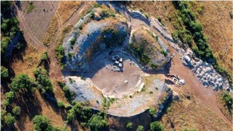
Snimak rimskog amfiteatra u Burnumu iz zraka

Također se ne smije zanemariti činjenica postojanja lako dostupne sedre s obližnjih sedrenih barijera zbog njezine čvrstoće i male težine, koja je primjerice korištena za izgradnju građevine burnumskog amfiteatra. 26 Stilske i tipološke analize pokazuju da su kamenoklesarske radionice sasvim izvjesno postojale na području rimskog Burnuma. 27 Razvitak logora