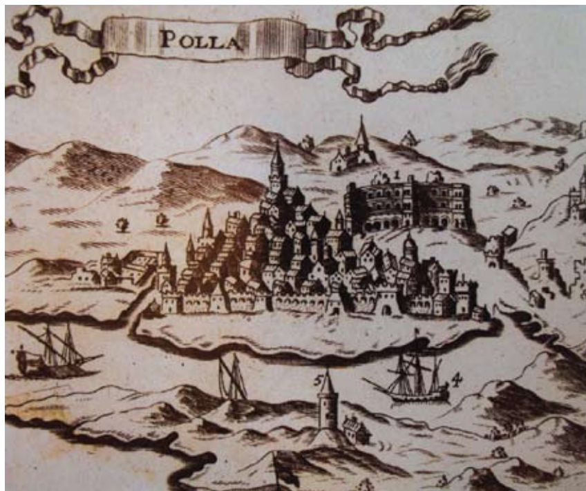
Prikaz vedute grada Pule i njegova amfiteatra

ganjem i suprotstavljanjem senatora Gabriela Emma dotična se besmislena odluka na svu sreću nije sprovela u djelo. 16