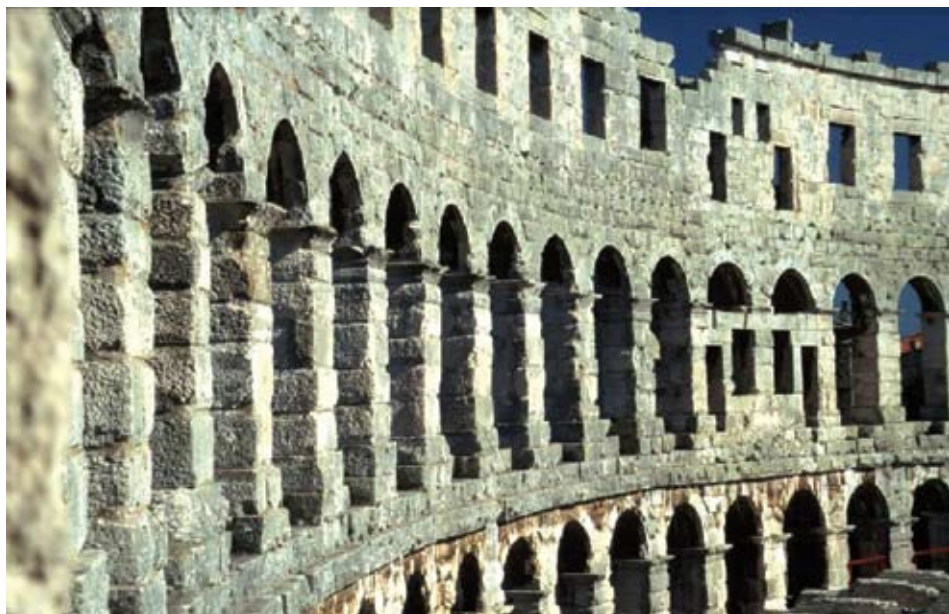
Prikaz unutarnjeg dijela plašta amfiteatra u Puli

Amfiteatar na području rimskodobne Pule sagrađen je na ukupnoj površini od 11.466 m 2 što ga svrstava na šesto mjesto među poznatim i sačuvanim takvim građevinama u sklopu prostranog Rimskog Carstva. 1 Izuzetno geometrijski pravilna građevina amfiteatra, duljine 132.45 m (450 stopa, duža os = sjever – jug) i širine 105.96 m (360 stopa, kraća os = istok – zapad) daje među osima savršen odnos 5:4. 2 Pulski amfiteatar izgrađen je od krupnoga rustično oblikovana kamena koji daje dojam snage i grubosti, što je ujedno u skladu sa sveukupnom namjenom dotične građevine. Zidni plašt s velikim polukružnim otvorima izgrađen je od pravilnih blokova kamena vapnenca različitog varijeteta ( opus quadratum ) vađenog u “ Cave romanae ” kod Vinkurana, dok je unutrašnjost građena od kamena lomljenca rakaljskih kamenoloma i kamenoloma Soline (Valsaline) kod Rovinja. 3 Unutarnji dijelovi temelja, koji nisu bili vidljivi, kao i zidovi unutarnjih tehničkih hodnika, prolaza i stepeništa, bili su također građeni od sitnog kamenja vezanog žbukom, s ožbuka-