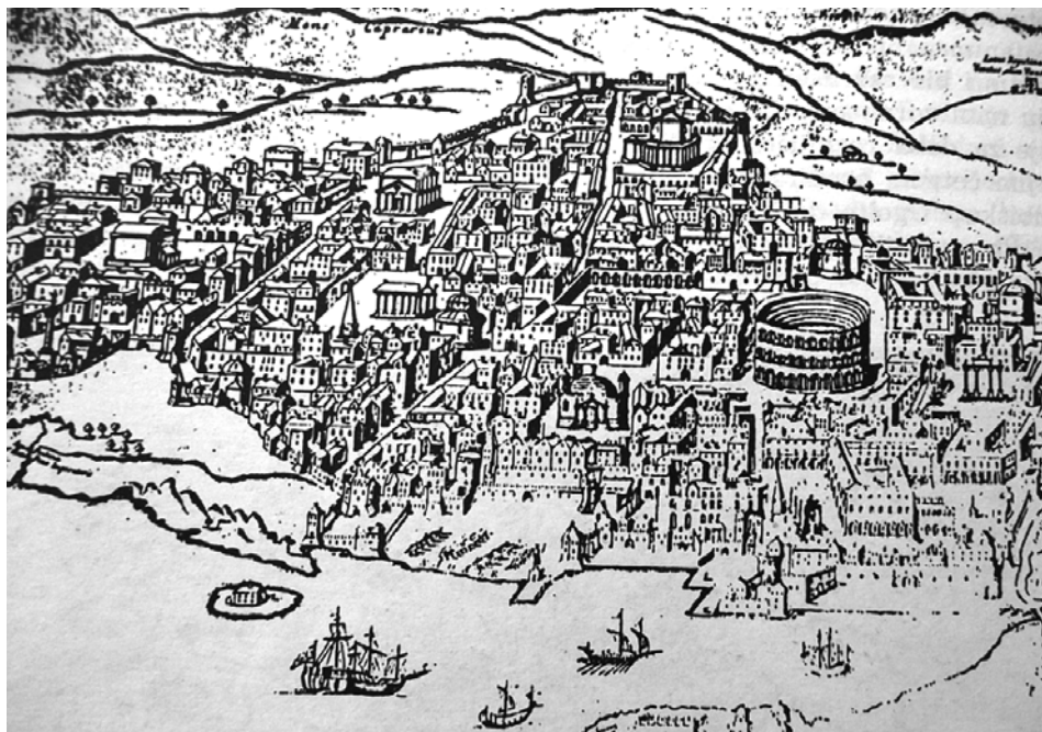
Prikaz Salone i njezinog amfiteatra prema Farlatiju

izgradnjom i, eventualno, održavanjem jedne tako velike javne građevine. Također se smatra da je ujedno bio nadzornik radova u škripskom kamenolomu kada se vadio kamen za izgradnju amfiteatra u Saloni. 43