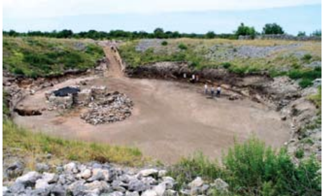
Pogled na arenu i neistražena gledališta burnumskog amfiteatra

Također se ne smije zanemariti činjenica postojanja lako dostupne sedre s obližnjih sedrenih barijera zbog njezine čvrstoće i male težine, koja je primjerice korištena za izgradnju građevine burnumskog amfiteatra. 26 Stilske i tipološke analize pokazuju da su kamenoklesarske radionice sasvim izvjesno postojale na području rimskog Burnuma. 27 Razvitak logora