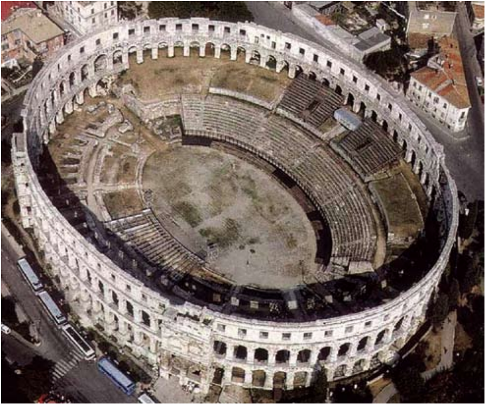
Pogled na amfiteatar u Puli

dekoracija u pulskom amfiteatru zbog toga što su i sami sudionici u gladijatorskim nastupima često bili egipatskog podrijetla.