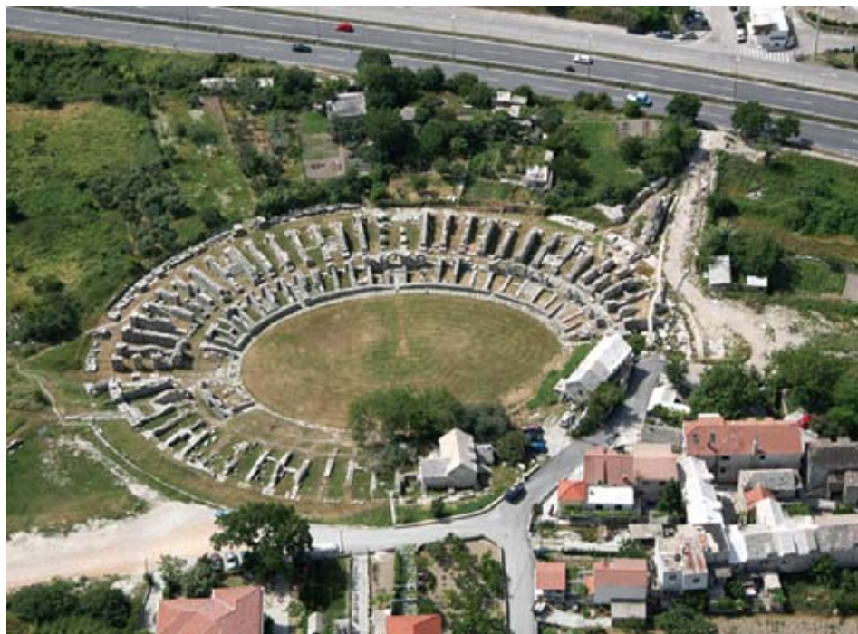
Prikaz sadašnjeg stanja očuvanosti salonitanskog amfiteatra

Podizanjem novoga prstena obrambenih zidina rimske kolonije Salone sa njezine zapadne strane, djelomično je obuhvaćena ujedno i građevina amfiteatra tako da je skinut njezin vanjski plašt s arkadama. Dotičan bedem se prislanja na radijalne zidove strukture gledališta ponekad inkorporirajući završne pilone radijalnih zidova ili ih zamjenjuje zidanom strukturom, te je na taj način potpuno zatvoren amfiteatar s te vanjske strane. 39 U zidanoj strukturi bedema upotrijebljeni su kao spolija veći arhitektonski dijelovi građevine amfiteatra ili pak usitnjeni iverci obrađenih klesanaca koji su često odbačeni kao građevinski šut. Također je otkriven vanjski pločnik amfiteatra na kojemu je počivao vanjski plašt amfiteatra rastvoren arkadama koji je uklonjen prilikom gradnje bedema i zasut građevinskim šutom sa znatnim ostacima kamenih iveraka. 40 Istovjetnu sud-