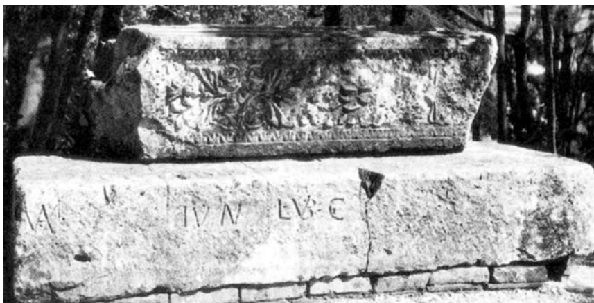
Prikaz stepenice s označenim sjedištima iz amfiteatra u Puli

Nakon pada klasične civilizacije, pulski amfiteatar bio je prepušten sudbini vjekova, koja je prije ili poslije zadesila i ostale amfiteatre na području Rimskoga Carstva. Tako je primjerice tijekom srednjeg vijeka pulski amfiteatar uglavnom služio za ispašu stoke koja je prehranjivala lokalno stanovništvo ili pak za održavanje povremenih sajмова, a ponekad su se znali održati i viteški turniri u organizaciji malteških vitezova. 13 Senat grada Pule strahovao je da će blizina Arene umanjiti gradsku obrambenu važnost, jer bi je neprijatelj u slučaju rata mogao napuniti zemljom i tako s visoka gađati grad i njegove obrambene točke. Stoga se u nekoliko navrata pojavio plan rušenja amfiteatra, do čega, na svu sreću, nije došlo. 14 Građevine amfiteatra su pritom izgubile svoju prvotnu funkciju i društveni