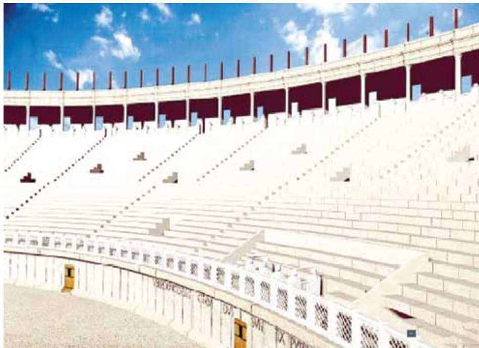
Idealna rekonstrukcija unutrašnjosti salonitanskog amfiteatra

Cjelokupna građevina amfiteatra sagrađena je od kamena. Vapnenac potreban za gradnju ovog monumentalnog amfiteatra vađen je i dovezen na gradilište salonitanske arene djelomice iz neposredne blizine Trogira, a dijelom sa obližnjeg otoka Brača. 42 Dva natpisa nađena u škripskim kamenolomima potvrđuju da su pojedini spomenici sa područja antičke Salone rađeni u tamošnjim radionicama i iz tamošnjega kamena, poznatoga bijelog vapnenca. Prvi natpis govori o donaciji centuriona Prve belgijske kohorte ( coh. I Belgarum ) koji sebe naziva curagens theat(ri) , dakle zadužen za, kako se opravdano pretpostavlja, solinski teatar. Drugi natpis podigao je Jupiteru centurion Treće alpinske kohorte, s nazivom Antoninijanska ( coh. III Alpinorum Antoniniana ), Tit Flavije Pompej, koji sebe predstavlja kao curam agens fabricanea amphiteatri , što se tumači kao funkcionirajuća osoba u nekoj instituciji koja je bila dugoročno zadužena da brine nad