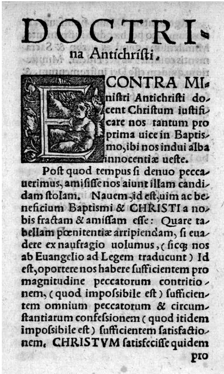
Breues Summae Religionis Iesu Christi, & Antichristi. Naslovnica poglav- lja o Antikristovu nauku.