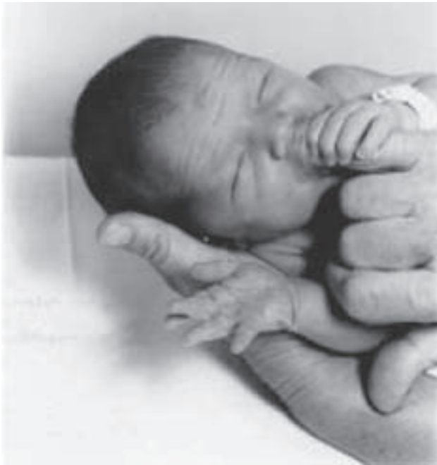
Slika 3. Povezanost ispitivača i novorođenčeta starog dva dana 39 Figure 3. Connection between examiner and newborn two days old 39