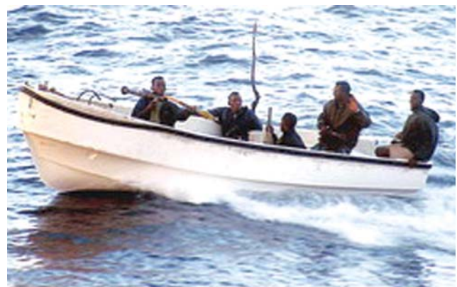
Slika 2. Somalski pirati Figure 2. Somalia pirates

Statistički podatci pokazuju da su napadi najčešće u ranojutarnjim satima prije izlaska sunca i pri zalasku. Napadaju u skupinama, malim i brzim motornim čamcima prilazeći brodu po krmi s lijeve i zdesne strane nastojeći se popeti na brod, najčešće na strani brodske skale, gdje je brodsko nadvođe najniže. Brodovi koje otimaju uglavnom plove brzinom manjom od 15 čv. Upotreba vatrenog oružja (automatske puške i ručni minobacači) postaje sve učestalija u njihovu nastojanju da zaplaše posadu i zaustave brod.