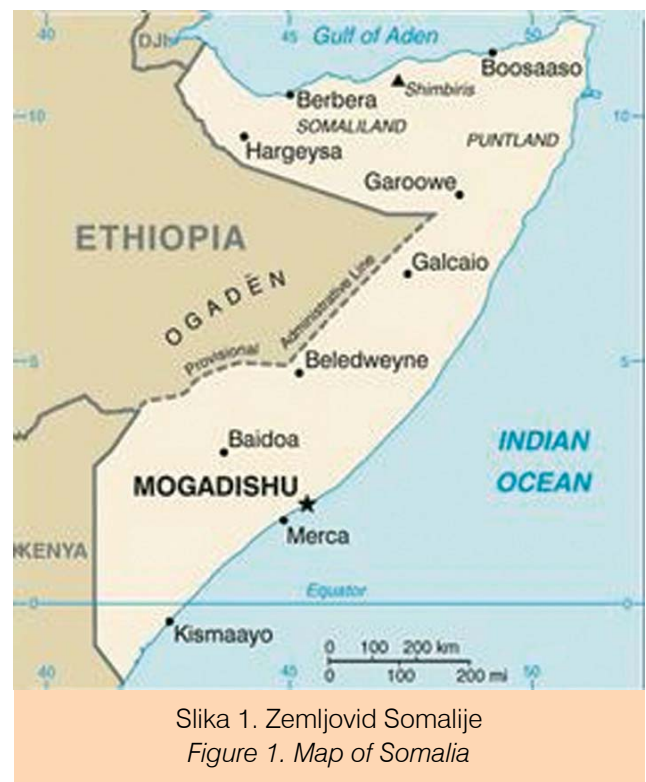
Slika 1. Zemljovid Somalije Figure 1. Map of Somalia

Somalija se nalazi na afričkoj istočnoj obali („Rog“ Afrike), uz Indijski ocean. Proteže se na teritoriju površine od 637.657 km 2 i uz dio obale afričkoga kontinenta dug 2.720 km. Glavni je grad Mogadishu. Prema podacima UN-a iz 2009. godine, broj je stanovnika 9,1 milijuna, većinom islamske vjere.