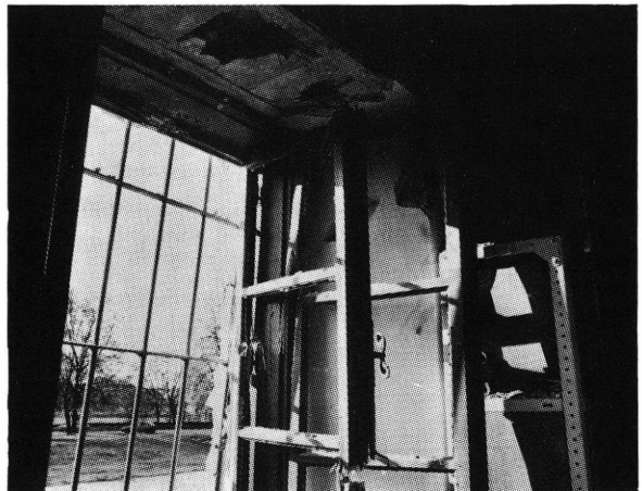
Južna strana zgrade Historijskog arhiva u Osijeku 16.XI.1991.