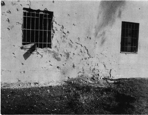
Južna strana zgrade Historijskog arhiva u Osijeku, 16.XI.1991.