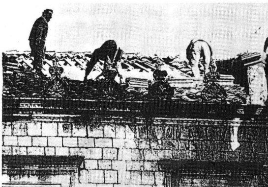
HA Dubrovnik, Sponza – južno krilo