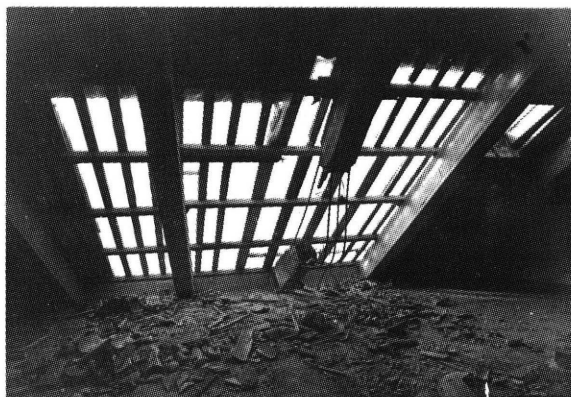
Historijski arhiv Dubrovnik, Palača Sponza

Bombardiranje stare gradske jezgre Dubrovnika je započelo u 5,45 sati i trajalo punih deset sati. Sponza je tada pogodena sa 7 pogodaka, projektilima tipa "maljutka". Pet granata je palo na krov zgrade prouzročivši kratere od 10 do 15 m 2 . Jedna je granata pala u atrij zgrade i oštetila zidnu plastiku dok su sva prozorska stakla popucala. Drvenarija, vrata i prozori izrešetani su gelerima. Druga granata pogodila je opet istočni zid, ali nije prouzročila veća oštećenja. Prednji dio krovišta je urušen. (I. Mustać)