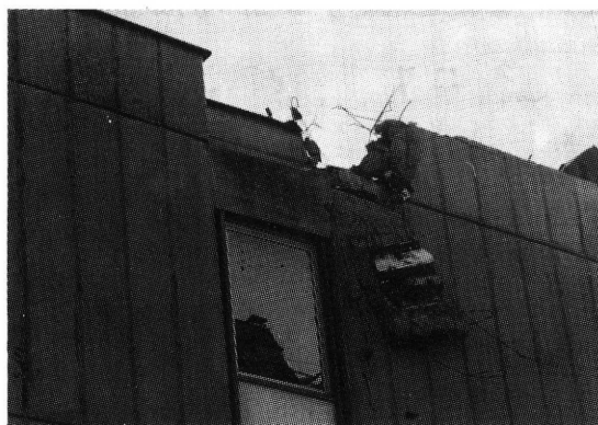
Direktni pogodak na krovnju konstrukciju Arhiva sa zapadne strane, 6/7.X.1991.