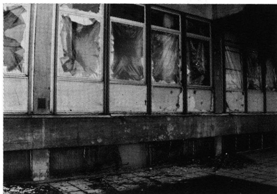
Pogled s druge strane na uništenu radionicu i fotolaboratorij HA Karlovac