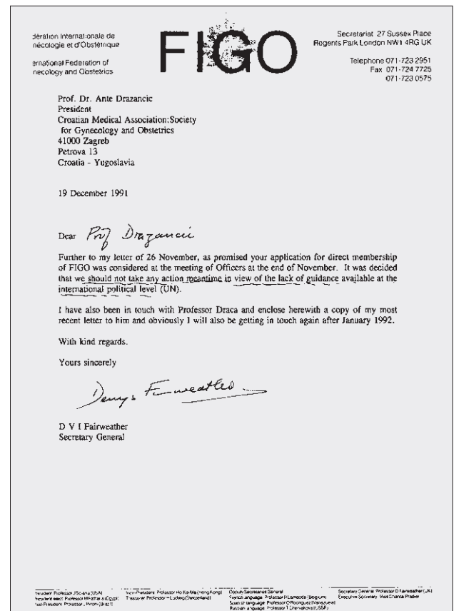
Slika – Figure 2.