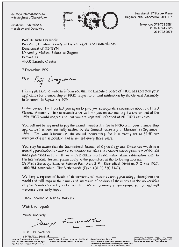
Slika – Figure 3.

stetričkom odboru (»Boardu«) bio je A. Dražančić. EBCOG je Specijalistička Sekcija UEMS-a, i danas je vodeći ginekološko-obstetrički »Board« u Europi, funkcionira i kao uprava Europske asocijacije ginekologa i opstetričara (EAGO-a).