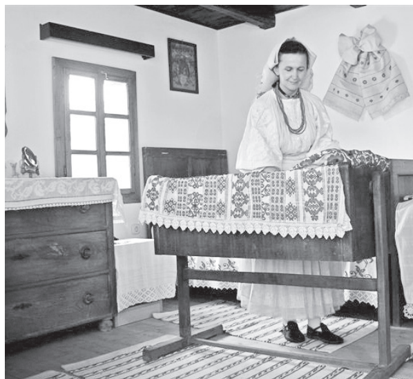
Unutrašnjost tradicijskog doma, Stara Subocka