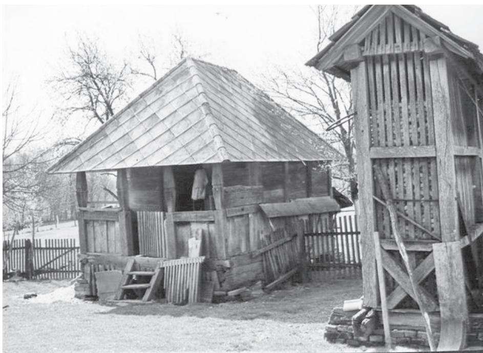
Ambar i kukuruznjak

Prilikom izgradnje gospodarskih objekata u stajski prag uglavljivala se konjska potkova za mir, dobro i zdravlje životinja.