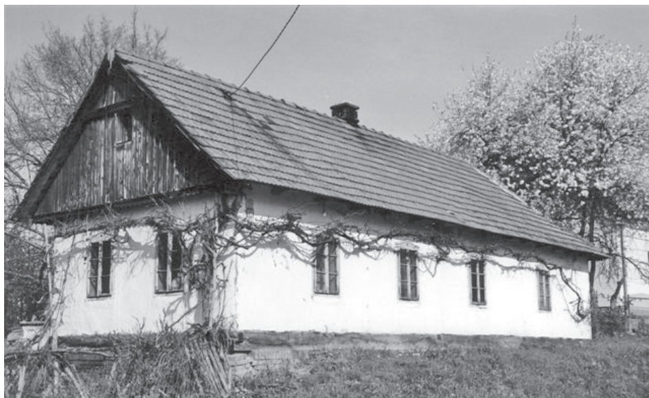
Prizemnica, kuća na kanate – sjeverna Moslavina

Na proplancima i svježim krčevinama sjeveroistočne Moslavine gradile su se kuće od debelih hrastovih dasaka – daščare , ili od brvna – brvnare , građene tako da se između vertikalnih stupova ugrade komadi kalanog drveta, a zatim s vanjske i unutarnje strane olijepe blatom. Ovaj način gradnje prizemnica, izduženog tlocrta, uobičajeno podijeljen u tri glavne prostorije - ognjenka , soba i komorak ili sobca - zadržao se sve do današnjih dana. U središnjoj glavnoj prostoriji boravilo se tijekom čitavog dana, tu su se obnašale razne svečanosti i obavljali svečani obredi. Pred ulaznim vratima ili ispred kuće dočekivali su se ophodari 3 koji su,