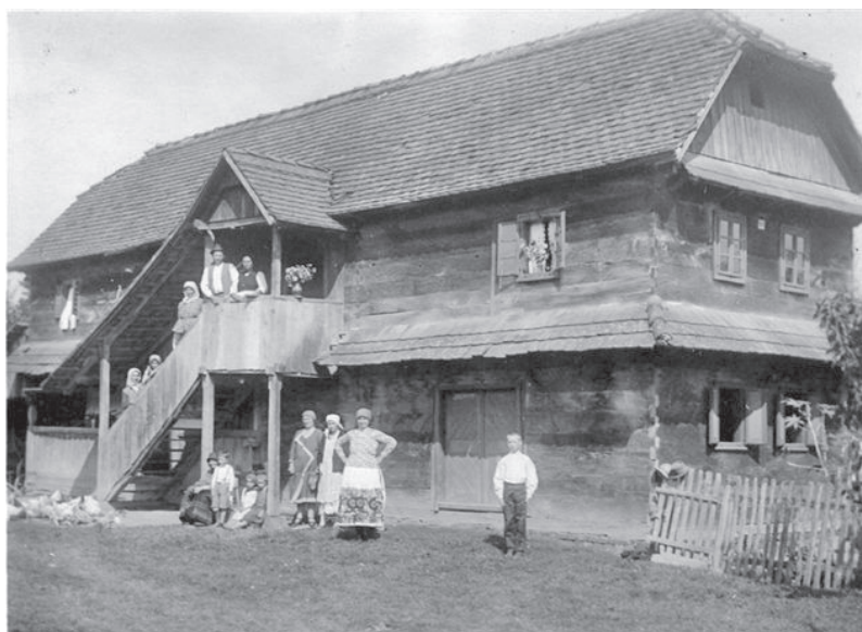
Tradicijska kuća južne Moslavine - trijem, "trem", Voloder

Prema tipu, kuće su podijeljene na prizemnice i katnice. Prizemnice mogu biti dvoprostorne i, ako jesu, tada je to stariji tip, ili troprostorne – i jedne i druge najčešće imaju izvanjski ulaz sa ganjkom ili bez njega. U troprostornima je središnji prostor kuhinja, prema ulici je velika soba, iža , a treća i zadnja prostorija jest manja sobica , ižica .