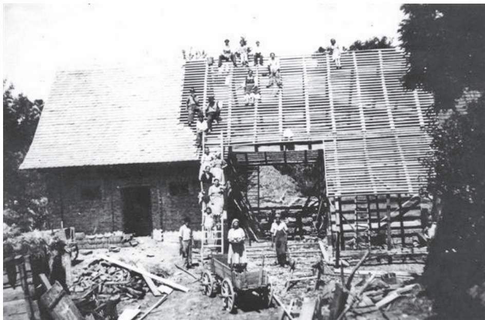
Pokrivanje gospodarskog objekta biber crijepom (1930-ih), Okoli

Osobitu ulogu imao je i krov. Kad se kuća poletvala, gore je išel cimer , tj. ukrasna grabova ili bukova grana okićena vrpčama gužvanog papira, ručnicima, maramama, pa čak i rubačom. Na sami vrh okačila se boca s pićem, najčešće je to bila rakija šljivovica kojom se na kraju posao dobro zalio. 5