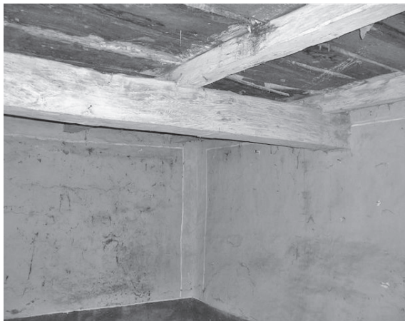
Način spajanja greda i planjki, Predavec

Na kat se dolazi shodićem , tj. vanjskim, natkrivenim stepenicama, stubama ili štengama, držeći se za rukohvat – linu , koje vode na prvi kat, a pretprostor na katu iz kojeg se ulazi u sobu ili družinsku hižu, jest gang , ganjak , ganjerak ili grančerec .