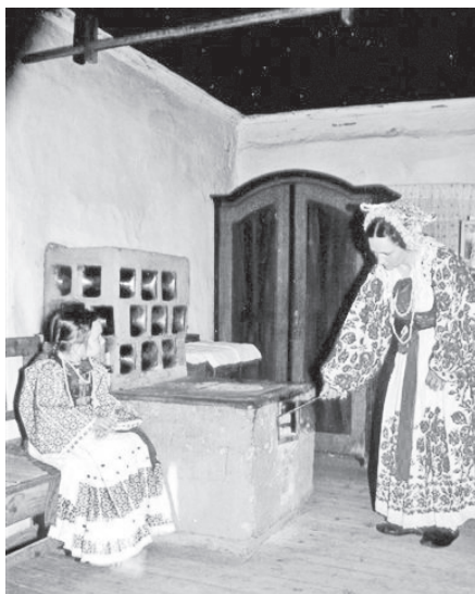
Tradicijska peć – “banak” Zaklepica