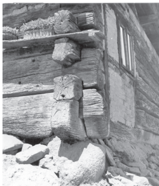
Veliki riječni kamen - babac - stavljao se na uglove trijema, Kutina

Ulaz u stambeni objekt nalazi se s južne strane, a štiti ga natkriveni pristašek ili kapić , trijem sa ili bez rešetkastog ukrasa.