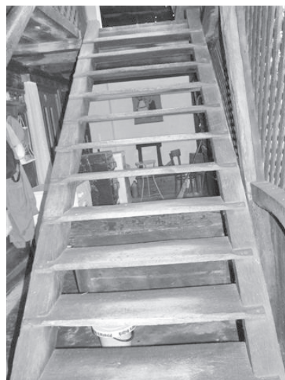
Stepenice ili stube, Donja Gračenica