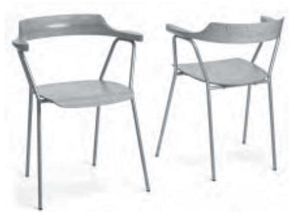
Slika 5. Stolica 4455

Već 1935. godine najavio je novosti u primjeni materijala za proizvodnju namještaja, koje je ostvario s namještajem Futura. Zagovarao je izradu namještaja od prirodnih materijala ili je nastojao da barem površine koje su u dodiru s korisnikovim tijelom budu oplemenjene prirodnim materijalom.