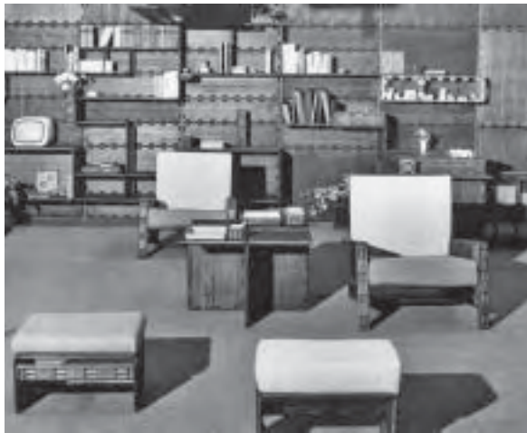
Slika 3. Namještaj Futura

dodijelila status umjetničkog proizvoda koji je izložen u newyorškom Muzeju moderne umjetnosti MOMA-i.