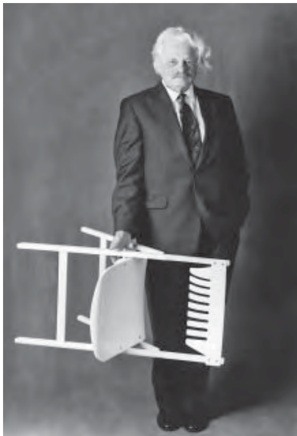
Slika 1. Niko Kralj

Niko Kralj utemeljitelj je slovenskoga industrijskog oblikovanja. Kao međunarodno priznati stručnjak na području oblikovanja u drugoj polovici 20. st. uvršten je među najznačajnije dizajnere u svijetu. Njegova inovativna rješenja podarila su svijetu nekoliko bezvremenskih primjeraka namještaja, a brojne domaće i strane nagrade govore o kvaliteti Kraljeva rada na području