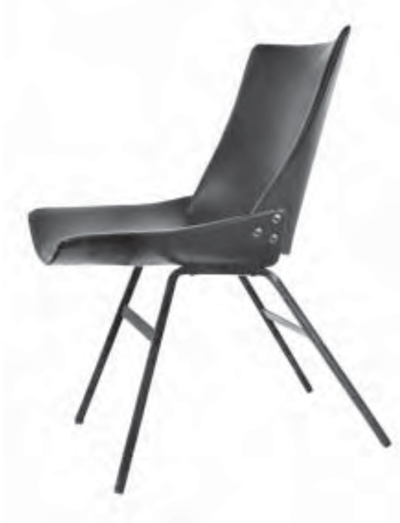
Slika 4. Stolica Lupina

Niko Kralj svoj je profesionalni put započeo u gospodarstvu, nastavio ga prijenosom znanja i iskustva mladim naraštajima na Fakulteti za arhitekturo, a njegova predavanja slušali su i studenti Biotehniške fakultete u Ljubljani. Bio je osnivač i predstojnik Instituta za oblikovanje. Registrirao je 118 patenata i modela. Bio je inovator i izumitelj na najrazličitijim područjima. Da je riječ o svjetskom dizajneru govori i podatak o njegovu druženju s najeminentnijim europskim dizajnerima među kojima su Charles Eames, Richardom Menti, Richard Buckminster Fullerom, Mies van der Rohem, Marc Zanuso, Tobio Scarpa i drugi. Od 1950-ih do 1970-ih Niko Kralj bio je među najboljim industrijskim dizajnerima prema svjetskim mjerilima.