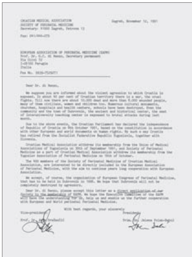
Slika 3. Pismo pristupa Sekcije za perinatalnu medicinu ZLH-a Europskoj udruzi za perinatalnu medicinu.