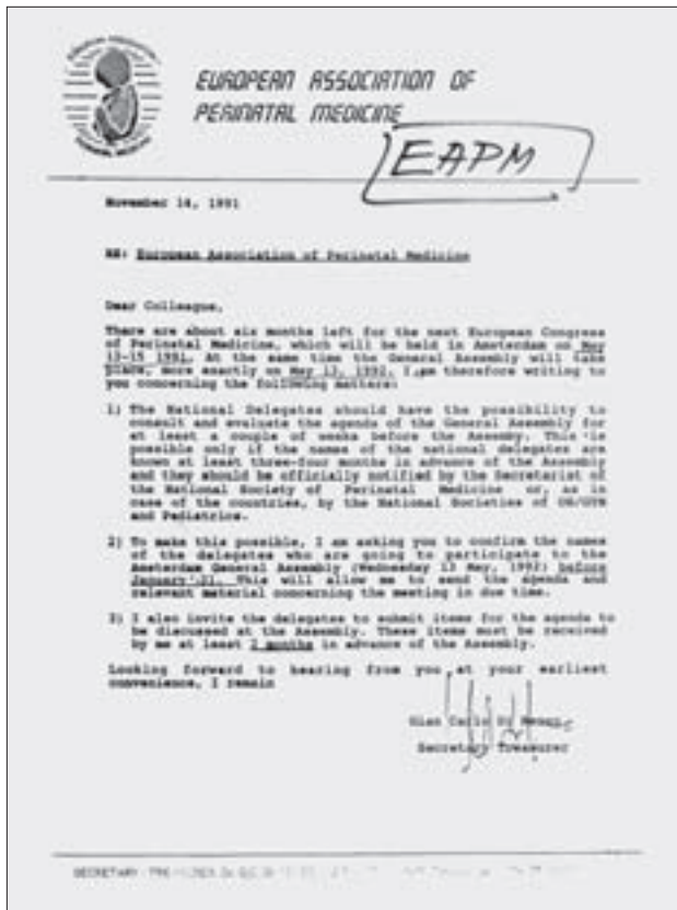
Slika 4. Poziv glavnog tajnika-rizničara EAPM-a Di Renzo za izbor dvaju delegata za skupštinu EAPM-a u Amsterdamu 1992. godine.

Figure 4. Call of secretary-treasurer Di Renzo to elect two delegates for the general Assembly of EAPM in Amsterdam in 1992.