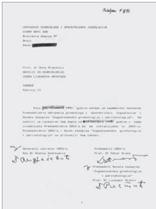
Slika 2. Prihvaćanje povlačenja Ginekološke sekcije ZLH-a iz UGOJ-a.