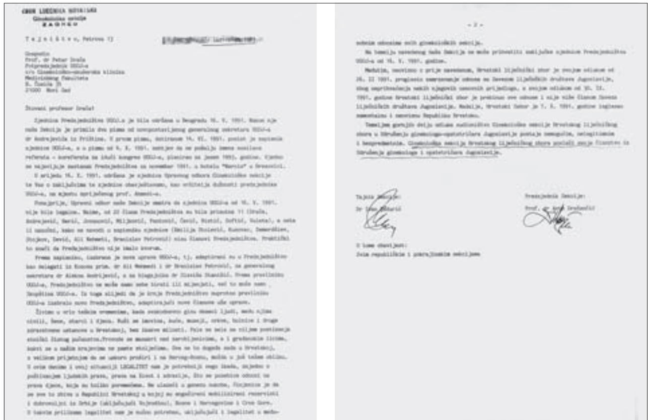
Slika 1. Povlačenje Ginekološke sekcije ZLH-a iz UGOJ-a.