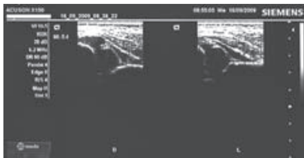
Slika 2. – Figure 2. Luxatio coxae congenita lateris dextri (IV, Ia)

113 (80,7%) dojenčadi u odnosu na 23 (16,4%) sublukzacije i 4 (2,9%) luksacije kuka. Slična je bila zastupljenost strane kuka u odnosu na spol, no bez značajne razlike ( p>0,05 ).