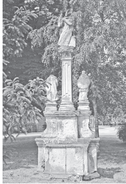
Sl. 6b. Pil sv. Florijana u Legradu, pogled straga, Fotodokumentacija HRZ-a; snimila N. Vasić, 2008.

koji je srodan kamenu tipa vinicit iz okolice Varaždina, utvrđena je izrazito štetna koncentracija klorida u donjem dijelu spomenika, određen je sastav vapnene žbuke, kao i vrste sačuvanih pigmenata na kamenim elementima. 17 Iako je pil bio bojan u više navrata, pronađeni ostaci korištenih pigmenata nisu dovoljni za cjelovitu rekonstrukciju obojenja svih elemenata i stoga će biti prezentirana očišćena površina kamena. Ipak se, prema sačuvanim ostacima, barem može zaključiti da je praćena uobičajena paleta boja kod svakog od prikazanih svetaca. Tako je primjerice halja svetog Josipa bojana smeđe, a rub čipke na roketi svetog Ivana Nepomuka žutim okerom. Plašt svetog Florijana 18 obojen je crveno, njegov barjak crveno i smeđe, čizme tamnijim žutim okerom, dok je na građevini u plamenu uz