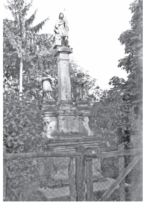
Sl. 2. Pil sv. Florijana u Legradu, Fototeka Ministarstva kulture, snimio Nino Vranić, 1960.

Gornji se dio sastoji iz središnjeg blago istaknutog pravokutnog i dva bočna dijela, skošenih stranica. S prednje su strane pila vanjski bridovi tih skošenih stranica ukrašeni volutama koje se povijaju u pravokutni meandar. Iako je površina ovih dvaju bočnih dijelova dosta oštećena, još uvijek su djelomično vidljivi tragovi ugrišenih brojaka koji potvrđuju dataciju nastanka pila 1735. godine. Središnji dio gornjeg postolja s prednje je strane ukrašen izbočenim reljefom koji je također dosta oštećen, no prema sačuvanim tragovima može se pretpostaviti da je prikazivao sunce sa zrakama ili motiv srca Isusovog u kaležu, također okruženog zrakama. Gornji dio postolja zaključen je bogatim profilom vijenca na koji su postavljene baze skulptura.