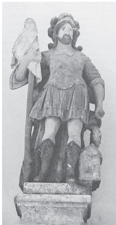
Sl. 9. Skulptura svetog Florijana s pila svetog Trojstva u Ludbregu, presnimka iz: Umjetnička topografija Hrvatske – Ludbreg , Zagreb 1997., str. 243.