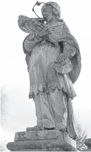
Sl. 4. Pil sv. Florijana u Legradu, skulptura sv. Ivana Nepomuka, Fotodokumentacija HRZ-a; snimila E. Šurina, 2009.

Lijevo od svetog Florijana skulptura je svetog Ivana Nepomuka ( sl. 4 ). Kult toga sveca raširio se tijekom 17. stoljeća u cijeloj središnjoj Europi, a 1729. godine službeno je priznat kao branitelj Crkve. Poznat je kao zaštitnik mostova, zagovornik protiv poplava 15 i zaštitnik ispovjedne tajne. Na legradskom pilu sve-