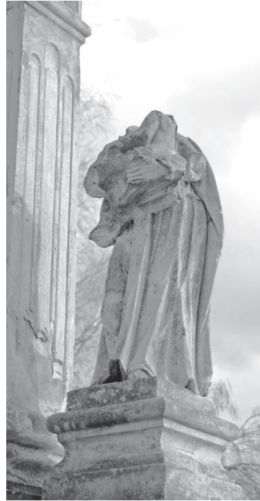
Sl. 5. Pil sv. Florijana u Legradu, skulptura sv. Josipa, Fotodokumentacija HRZ-a; snimila E. Šurina, 2009.