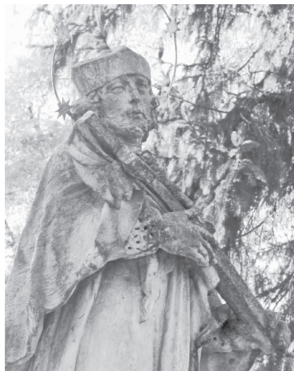
Sl. 10. Skulptura svetog Ivana Nepomuka, grupa pilova ispred župne crkve u Legradu, Fotodokumentacija HRZ-a, snimljeno 2002.