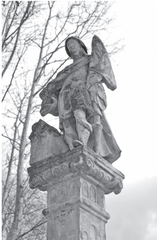
Sl. 3. Pil sv. Florijana u Legradu, skulptura sv. Florijana, Fotodokumentacija HRZ-a; snimila E. Šurina, 2009.

Sveti Florijan stoji frontalno, oslonjen na koplje sa zastavom, gledajući ispred sebe (sl. 3). Nažalost, lice sveca vrlo je oštećeno i nisu prepoznatljivi nikakvi elementi oblikovanja očiju, nosa, usta i same kamene površine. Obučen je u odjeću rimskog vojnika, s čizmama do koljena, a na glavi ima metalnu kacigu. U desnoj ruci drži posudu iz koje voda teče na zapaljenu zgradu. Takav je prikaz ovog sveca vrlo čest, jer se smatralo da je bio rimski časnik u nekoj rimskoj legiji koja je imala zadaću gasiti požar i spasavati imovinu. Iz opisa legendi o životu svetog Florijana, nije moguće ništa pouzdano reći o izgledu samog lika, pa se njegov prikaz prepuštao volji umjetnika (primjerice, u srednjem je vijeku prikazivan kao konjanik i oklopnik, ima bradu, a ponekad i brkove, no često je prikazan i kao golobradi mladić). Zanimljivo je da prvi zapis o svetom Florijanu kao zaštitniku