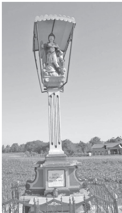
Sl. 8. Pil svetog Florijana u Malom Bukovcu

U bližoj pak okolici Legrada, spomenici svetom Florijanu podignuti su u Hrženici 21 i Hrastovskom, 22 a još jedan kameni pil posvećen ovom svecu 23 smješten je na prilazu naselju Mali Bukovec ( sl. 8 ). Za razliku od legradskog, taj je pil sačuvao samo svoje kameno postolje, visoki kanelirani stub s jonskim kapitelom i na vrhu skulpturu svetog Florijana koji je uobičajeno prikazan u odori rimskog vojnika dok gasi požar na kući. Nažalost, kamene skulpture koje su stajale zasebno na postamentima u podnožju središnjeg stupa nestale su. Poznato je da je jedan od svetaca bio sveti Josip, dok se ne zna titular drugoga. Sama figura svetog Florijana, osim što je u Bukovcu golobrad, nalik je kipu istoga sveca s pila svetog