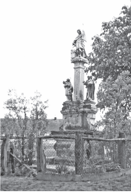
Sl. 1. Pil sv. Florijana u Legradu, Fototeka Ministarstva kulture, snimio Nino Vranić, 1960.