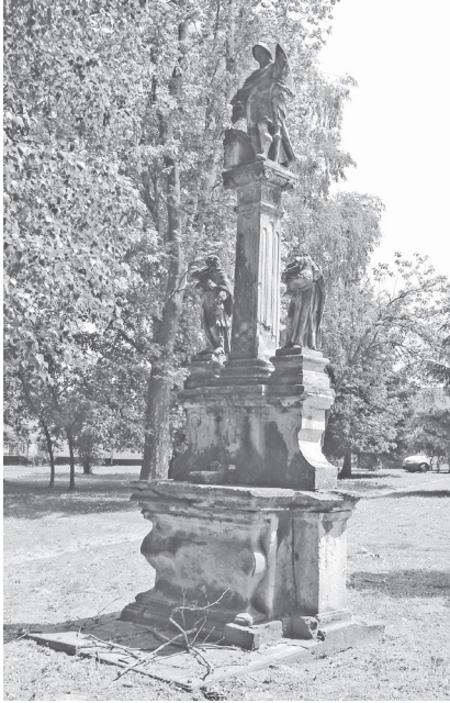
Sl. 6a. Pil sv. Florijana u Legradu, pogled sprijeda, Fotodokumentacija HRZ-a; snimila N. Vasić, 2008.