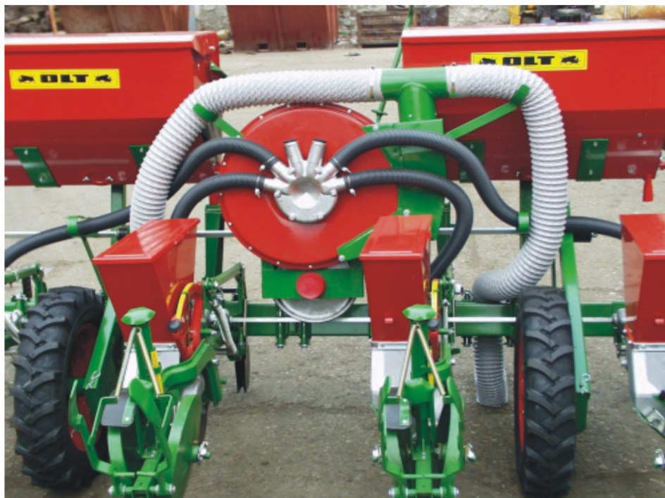
Figure 1 Manufactured set upgrade by company OLT

Sjeme i mlade biljke kukuruza najosjetljiviji su razvojni stadiji. Napadnute mogu biti velikom populacijom štetnika. U zadnje vrijeme sve veće gubitke kod proizvodnje kukuruza uzrokuje kukuruzna zlatica. Sovica pozemljuša, žičnjaci, grčica i ostali štetni kukci mogu prinos kukuruza i prepoloviti. Tretiranjem insekticidima sjeme i mlada biljka zaštićeni su od početka od napada štetočina. Zaštita sjemena i mlade biljke je