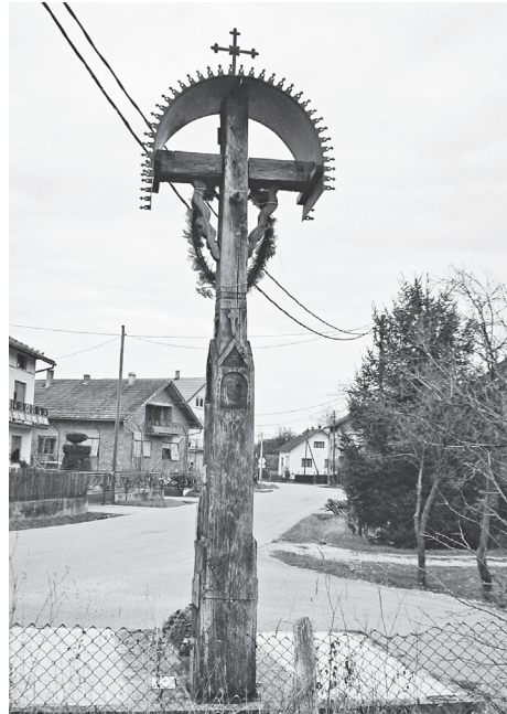
Križno drvo na raskrižju

vanjskim rubovima izrezani su ukrasi u obliku malih strelica, sa završetkom u obliku rombića zaobljenih stranica ( vidi crtež 2 ).