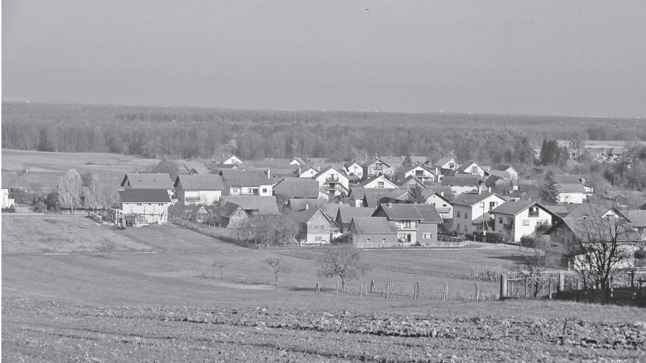
Pogled na zaselak Cuceki u Donjim Trpucima