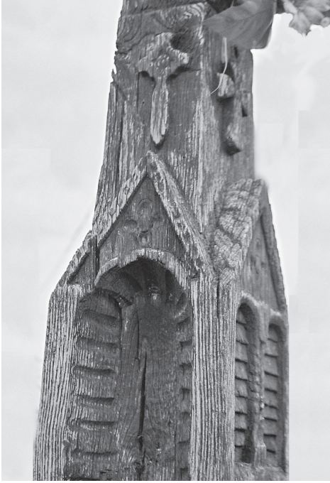
Središnji dio križnog drvea