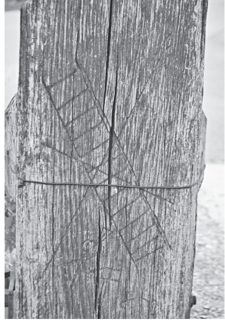
Simboli Kristove muke urezani u križno drveo