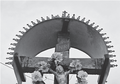
Detalj ukrasa limenog ruba krovića raspela

Deda Vinko pričao je da oni koji su odnijeli kipove nisu po pravici umrli.