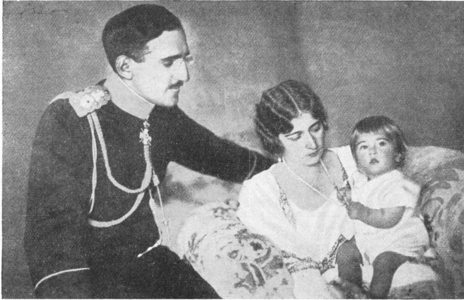
Kralj Aleksandar sa porodicom (Nj. Vel. Kraljica Marija i Nj. Vis. Prijestolonasljednik Petar)

Kada je najposlije u Narodnoj Skupštini pala krv (20. lipnja 1928.), kralj Aleksandar riješi se da sam uzme u svoje ruke svu politiku države. Dne 6. siječnja 1929. raspusti Narodnu Skupštinu, ukine Vidovdanski Ustav i imenova novu vladu s generalom Živkovićem na čelu a s programom stišavanja partijskih strasti i čuvanja narodnoga i državnoga jedinstva. S tim u vezi nova je vlada 3. listopada 1929. objavila umjesto dotadašnjega imena »Kraljevine Srba, Hrvata i Slovenaca« kao zajednički opći naziv države »Kraljevina Jugoslavija«, ukinuvši podjedno onih trideset i tri oblasti (županije) Vidovdanskoga Ustava i podijelivši državu na devet banovina. S novim imenom izlazi naša država otsada unaprijed pred čitav svijet kao jedinstvena nacionalna država s jedinstvenim narodom jugoslavenskim Srba, Hrvata i Slovenaca. Ovim je aktom Veliki Kralj Ujedinitelj udahnuo našoj državi dušu, a ova je dobila onda i spoljašnje svoje znamenovanje i u jedinstvenoj državnoj vojnoj zastavi. Dvije godine poslije nove podjele Kraljevine Jugoslavije, 13. rujna 1931., proglašen je novi Ustav. Po njemu je Kraljevina Jugoslavija nasljedna i ustavna monarhija sa dvodomnim sistemom (Narodna Skupština i Senat). Član 29. izrično ističe, da je kralj »zatočnik narodnog jedinstva i državne cjeline« . . .