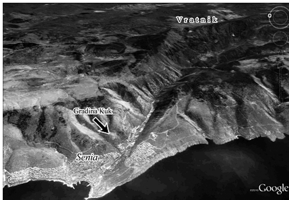
Sl. 4. Satelitski snimak Senjske drage i prijevoja Vratnik.

Slobodan ČAČE, Rim, Liburnija i istočni Jadran u 2. st. pr. n. e., Diadora , 13, Zadar, 1991.