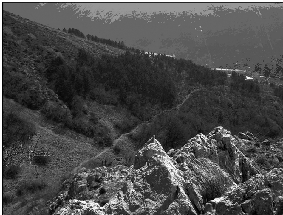
Sl. 2. Pogled s Kuka na pješačku stazu koja vodi od gradine na Vratnik.

Gradina Mali Goljak na istočnoj strani Vratničkog polja nalazila se na kraju spomenute prapovijesne komunikacije koja je kroz Senjsku dragu vodila do prijevoja Vratnik. Odnosno, Mali Goljak se nalazio na križanju komunikacija koje se računaju s jedne strane prema Monetiju (Brinje), a s druge prema Avendu (Kompolje) i Arupiju (Prozor). Iako značenje ovog lokaliteta još nije potvrđeno nekim ozbiljnijim arheološkim istraživanjima, njegovu važnost dokazuje i kontinuitet naseljavanja u antici kada postaje važno križanje na kasnijim rimskim prometnicama. 6