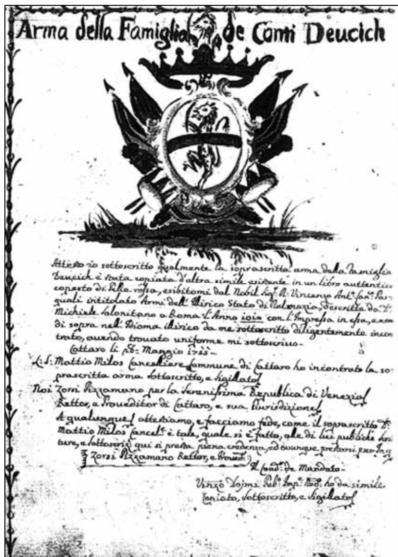
Sl. 3. Grb obitelji Devčić i potvrda Zorzi Pizzamana, rektora i providura kotorskog o grbu obitelji Devčić. 3