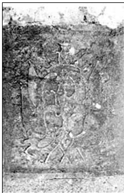
Sl. 1. Kameni grb obitelji Devčić (Groblje sv. Tekla u Podgori).