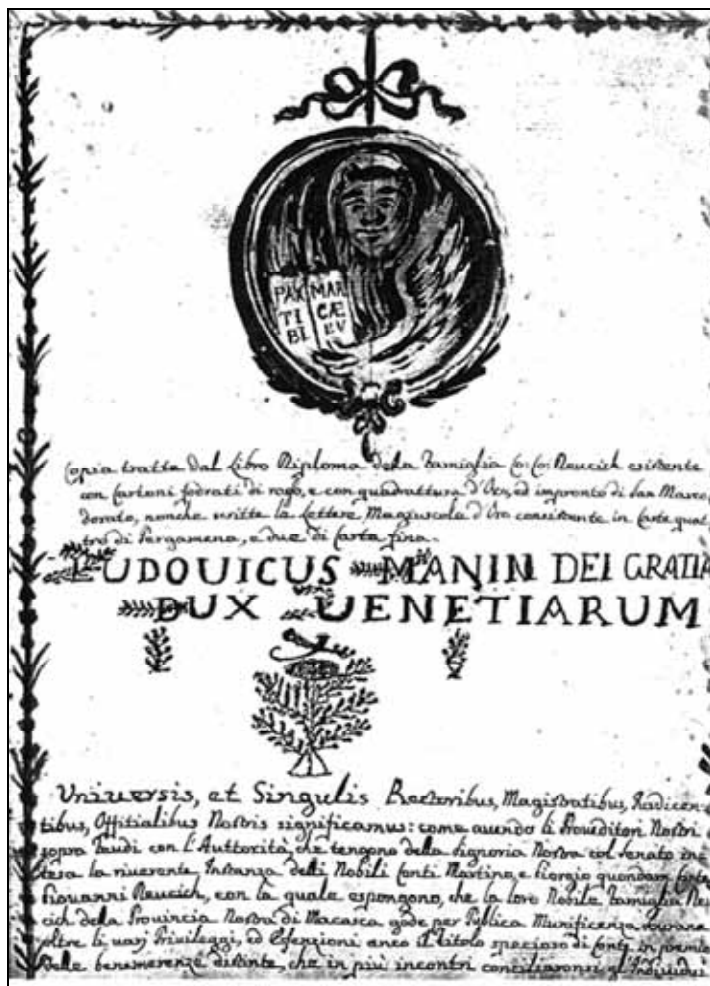
Sl. 5. Dio prijepisa dukale mletačkog dužda Lodovika Manina kojom se potvrđuje obitelji Devčić naslov "conte". 10