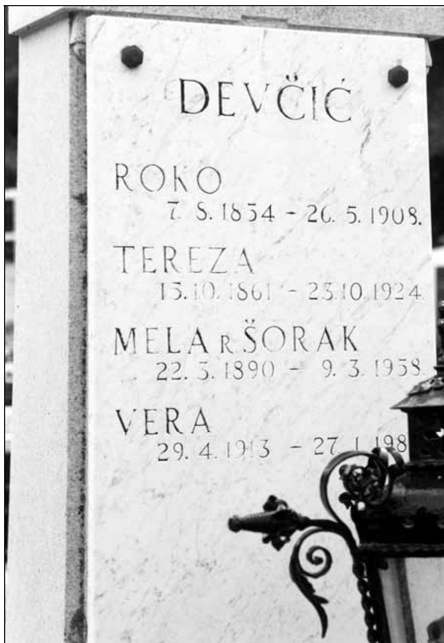
Sl. 7. Nadgrobna ploča obitelji Devčić.