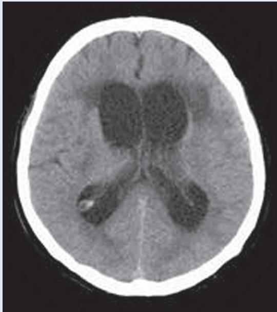
Slika 2. CT slika: Hidrocefalus s hipertenzivnom komponentom

Figure 2. CT image: Hydrocephalus with hypertensive component