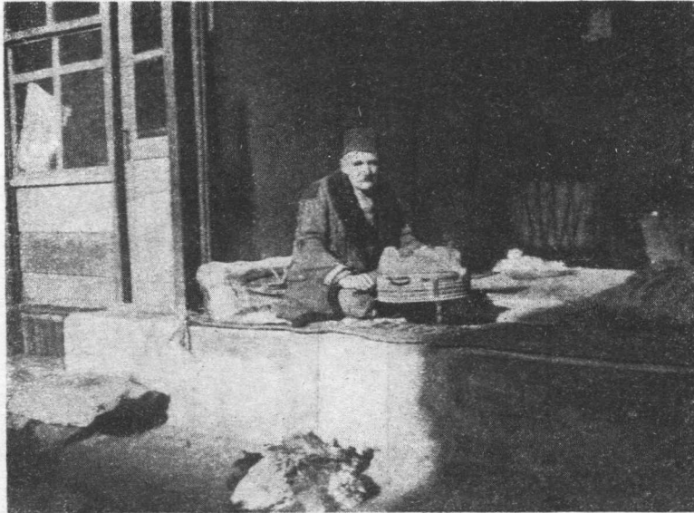
Iz jedne ulice u Bitolju

—, dijelom na srpsku numizmatiku — unikat jednog Dušanovog dinarića. Na polju jednog i drugog predmeta autor je do sada iznio veliki broj novih rezultata i »Rassegna Numismatica« nalazi laskavih riječi priznanja za stručnost i neumornost ovoga našeg istaknutog naučnog radnika.