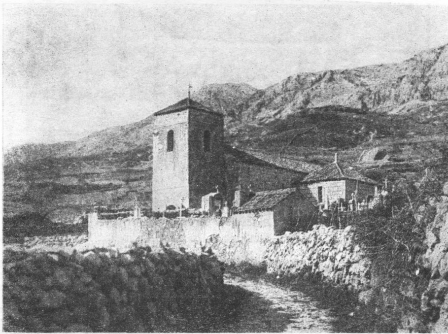
Crkva Sv. Lucije u Jurandvoru na Krku