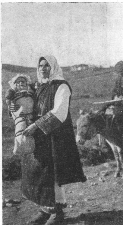
Ženska nošnja iz sela Bukova kraj Bitolja