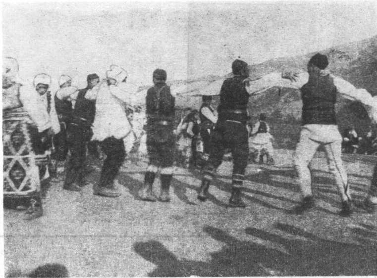
Muško kolo u okolini Skoplja

itd. Zbirke su se unazad 50 godina i pedesetorostručile te je skrajnje vrijeme da se pitanje novih muzejskih zgrada u Zagrebu uzme u pretes dakako na osnovi paviljon-skoga i ne-intendantskoga sistema.