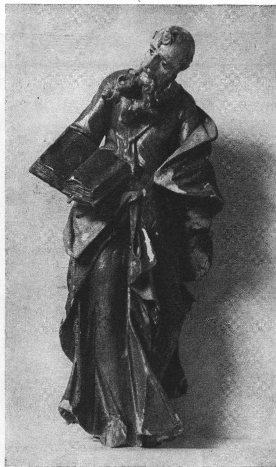
6. Drveni, obojeni i pozlaćeni kip sv. Pavla, izrađen od nepoznatog majstora oko 1770 godine. Navodno iz kapele sv. Ane u samoborskom starom gradu