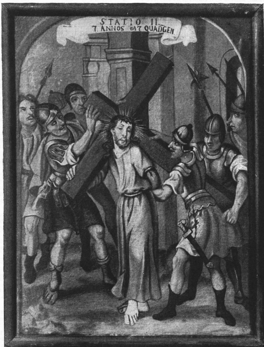
3. Nepoznati majstor XVIII. stoljeća: Druga postaja Križnog puta. Iz samostana Male braće u Krapini