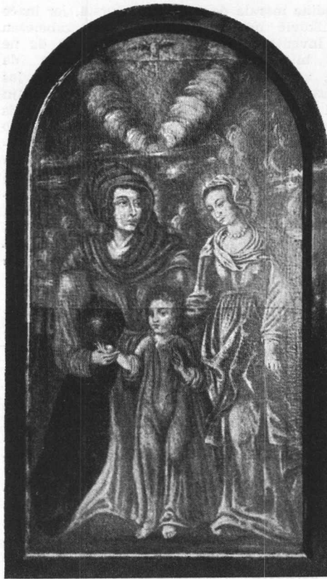
1. Nepoznati majstor oko 1600 godine. Sveta Ana Samotreća. Iz župne crkve sv. Anastazije u Samoboru