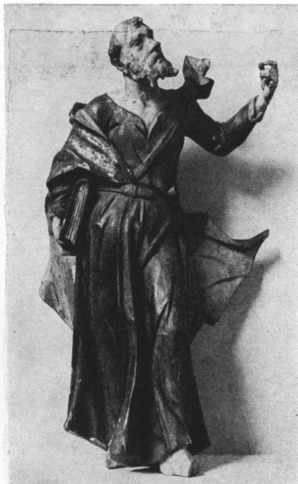
5. Drveni, obojeni i pozlaćeni kip sv. Petra izrađen od nepoznatog majstora oko 1770 godine. Navodno iz kapele sv. Ane u samoborskom starom gradu