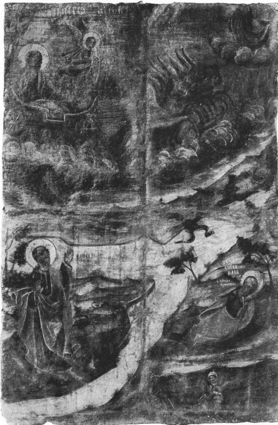
4. Nepoznati majstor XVIII. stoljeća. Prizori iz života sv. Ilije na jednoj strani crkvene zastave iz crkve u Mirkovcima kraj Vinkovaca