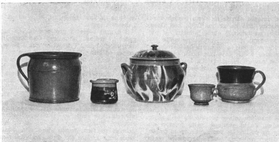
9. Zemljano posuđe iz bivše tvornice u Orahovici. Izrađeno sedamdesetih godina prošlog stoljeća

većinom samo broj 1, 2, 3, 4, 5 ili koji drugi, što označuje pojedine vrste kalupa.