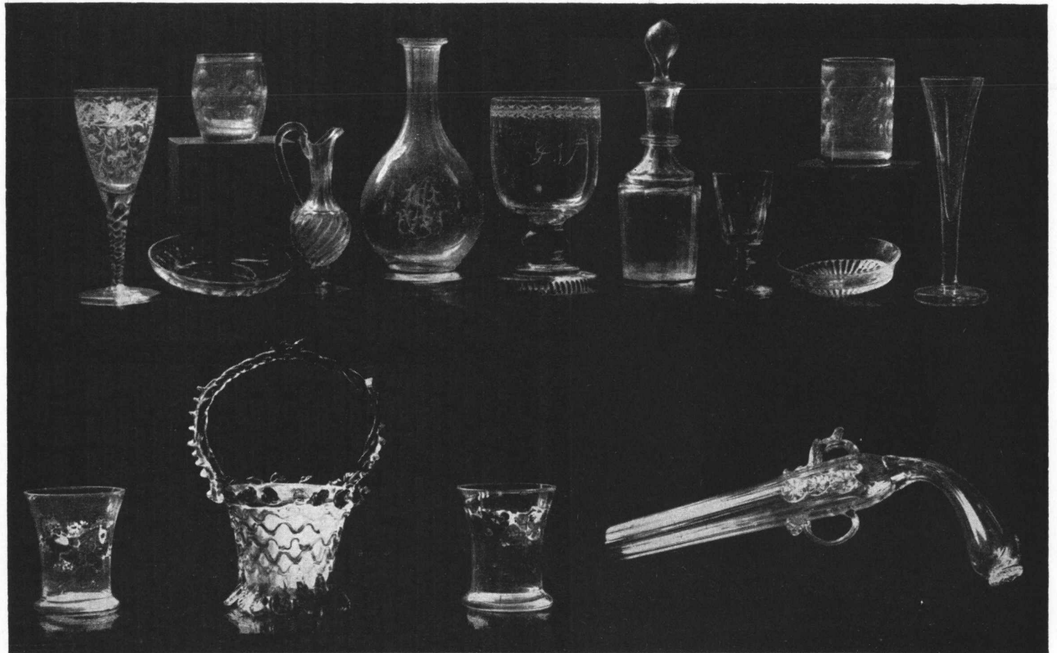
8. Staklo iz tvornice u Osretku i Karolini kod Samobora. — Raznobojno i oslikano staklo iz tvornice u Osretku kod Samobora. — Stakleni bilikum u obliku »pištolje« (kubure). Specijalitet bivše tvornice stakla u Osretku kod Samobora.