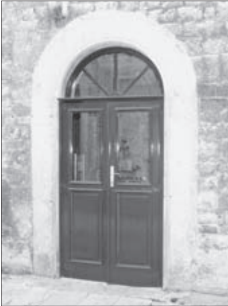
SL. 12. VRATA NA SJEVERNOM BOČNOM ZIDU CRKVE KROZ KOJA SE ULAZI U DVORIŠTE FIG. 12 DOOR ON THE NORTH LATERAL CHURCH WALL LEADING INTO THE COURTYARD