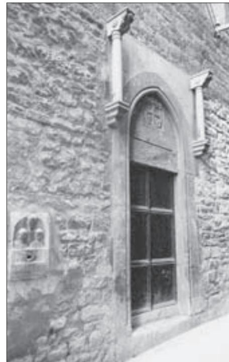
SL. 10. NAKNADNO UMETNUT GOTIČKI PORTAL U JUŽNI, NAJSTARIJI SAČUVANI ZID CRKVE. LIJEVO JE PRIKLESANA RIMSKA STELA U FUNKCIJI SKRABICE ZA MILODARE.

Jedno od takvih narušavanja dogodilo se 1924. godine, i to upravo na sklopu sv. Duha. Bratovština je započela dogradnju uz crkvu u dvorištu na sjevernoj strani. Napravljen je nacrt pa je naknadno, u tijeku radova, za-tražena od Općinskog upraviteljstva građevna dozvola. Službenici Tehničkog ureda Općine pregledali su projekt i obišli gradilište. Utvrđeno je da se stražnje dvorište izgrađuje u cjelini i tako zagušuje već zagusnuti okoliš na štetu javnog interesa i zdravstvenih uvjeta življenja. U dopisu Općinskog upraviteljstva bratovštini od 20. ožujka naglašeno je da je dvorište sastavni dio cjeline koja ne podnosi nikakav novi objekt i stoga treba očuvati postojeće stanje. Molba je odbijena. Naređeno je da se u roku od osam dana sve dotad izgrađeno poruši i uspostavi dvorište, kao i kameni bunar, u prijašnje stanje. Jedino naplavna površina bunara, koja je zasuta, može i dalje tako ostati. Određeno je da se svi rado-vi za povratak u prijašnje stanje moraju izve-sti u sporazumu sa stručnom službom Općine. O tome je pismeno obaviješten i konzervator starina. 21