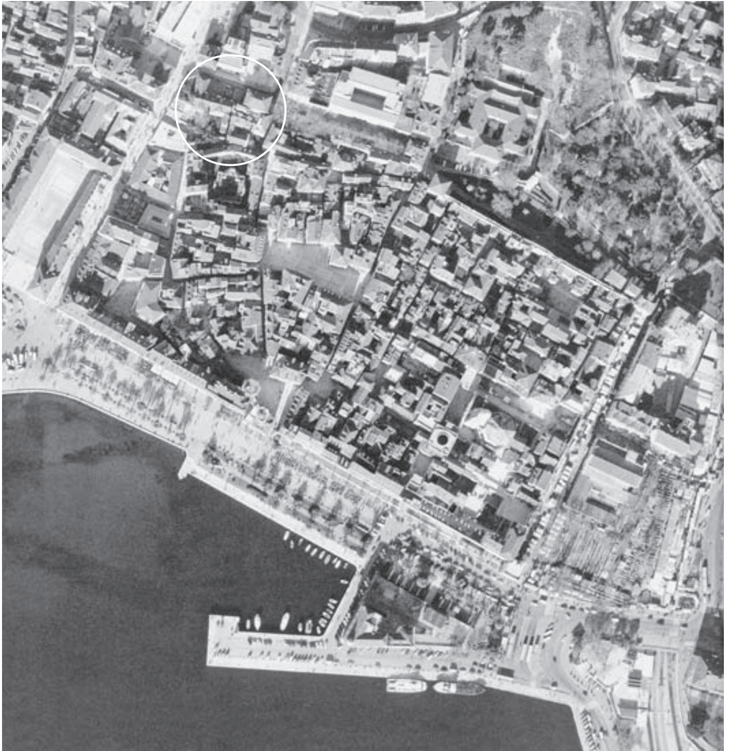
SL. 1. POLOŽAJ SKLOPA SV. DUHA U SREDNJOVJEKOVNOJ POVIJESNOJ JEZGRI SPLITA FIG. 1 POSITION OF THE ST SPIRIT COMPLEX WITHIN THE MEDIEVAL HISTORICAL CENTRE OF SPLIT