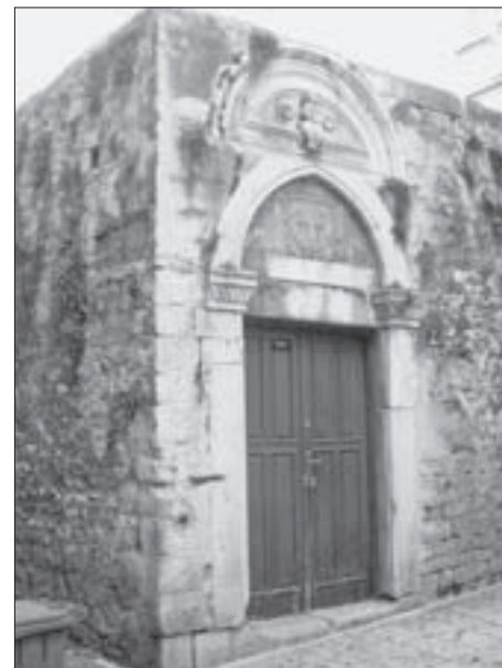
FIG. 11 COURTYARD FENCE WALL IN THE EAST SIDE OF THE COMPLEX WITH A GOTHC PORTAL AND ANOTHER LUNETTE OF AN OLDER DATE ABOVE IT