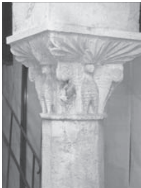
FIG. 9 ROMANESQUE CAPITAL FROM THE GROUND FLOOR LOGGIA OF THE BUILDING IN THE NORTH SIDE OF THE COMPLEX

stoljeća Turci su potisnuti dublje u unutrašnjost pa su nastale povoljnije prilike.