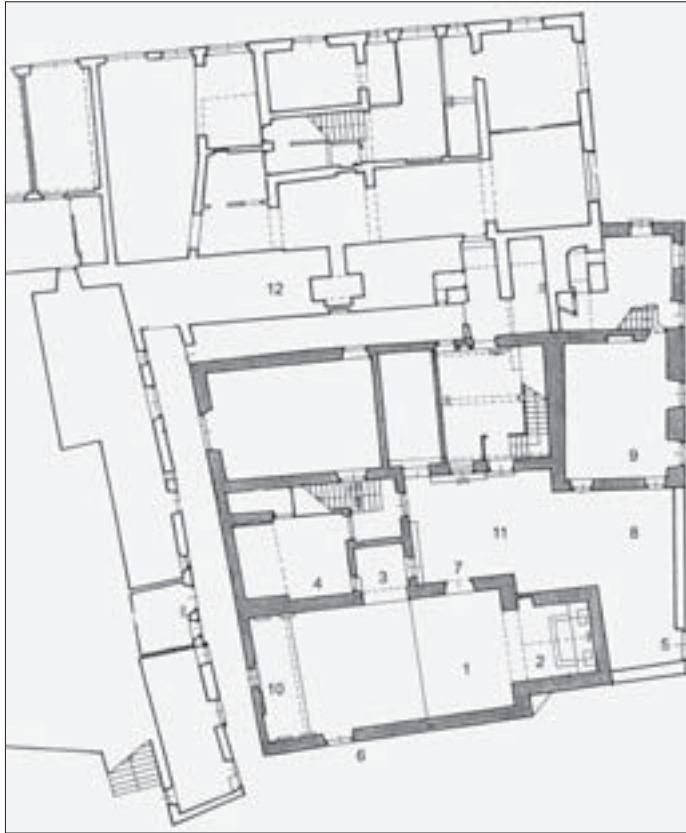
SL. 3. PLAN DANAŠNJEG STANJA SKLOPA: 1 – BROD CRKVE, 2 – SVETISTE, 3 – KAPELA, 4 – SAKRISTIJA, 5 – ULAZ U DVORIŠTE S ISTOKA, 6 – ULAZ U CRKVI S JUGA, 7 – IZLAZ IZ CRKVE U DVORIŠTE, 8 – DVORIŠTE, 9 – DVORANA, 10 – ZAZIDANA ROMANICKA VRATA NA ZAPADNOJ STRANI CRKVE, 11 – GROBLJE OKUŽENIH U DVORIŠTU, 12 – OSTATCI RENESANSNIH GRADSKIH BEDEMA

FIG. 3 PRESENT STATE PLAN OF THE COMPLEX: 1 – NAVE, 2 – CHOIR, 3 – CHAPEL, 4 – SACRISTY, 5 – EAST ENTRANCE TO THE CHURCH COURTYARD, 6 – SOUTH CHURCH ENTRANCE, 7 – ENTRANCE TO THE COURTYARD FROM THE CHURCH, 8 – COURTYARD, 9 – HALL, 10 – ROMANESQUE CHURCH WALLED-UP DOORWAY IN THE WEST PART OF THE CHURCH, 11 – PLAGUE CEMETERY IN THE COURTYARD, 12 – REMAINS OF RENAISSANCE CITY WALLS