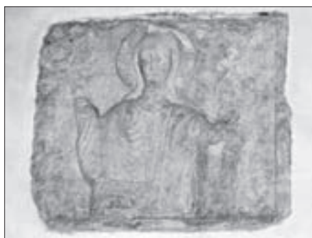
SL. 8. ROMANIKI RELJEF KRISTA, DANAS SMJESTEN U CRKVI FIG. 8 ROMANESQUE RELIEF OF CHRIST, TODAY SITUATED IN THE CHURCH

FIG. 7 INTERIOR SIDE OF THE NORTH WALL OF THE HALL AT THE NORTHEAST PART OF THE COMPLEX WITH REMAINS OF A GOTHIC ARCH AND VAULT.