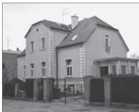
SL. 12. LJETNIKOVAC U ULICI G. KOVAČIĆA 7 FIG. 12 COTTAGE AT 7 G. KOVAČIĆ STREET