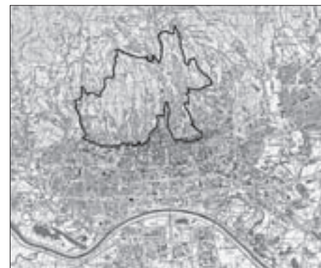
SL. 2. LJETNIKOVAČKI PREDJELI ZAGREBA FIG. 2 COTTAGE AREAS IN ZAGREB

• Propisi za izgradnju zgrada na Josipovcu iz 1888. godine – Ustanove za gradnju sgrada na Josipovcu , odobrene odlukom Visoke kr. hrvatsko-slavonsko-dalmatinske zemaljske vlade (Odjela za unutarnje poslove od 28. svibnja godine 1888. broj 17459), 15 propisuju