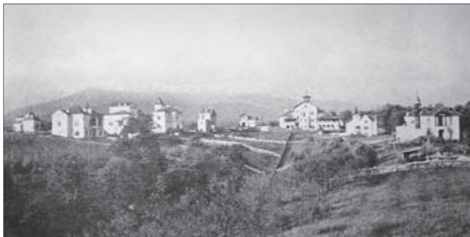
SL. 19. VILE-LJETNIKOVCI NA JOSIPOVCU, POGLED S JUGA, OKO 1890.

Izgradnja ljetnikovačkog područja Zagreba do Regulatorne osnove iz 1887.-1889. zanemarena je u cjelokupnom planiranju grada. 32 Tek propisi koji dopunjuju Red gradnje iz 1857. godine propisuju način izgradnje po sjevernoj, brježuljkastoj zagrebačkoj okolini. Najznačajniji pomak u regulaciji izgradnje na brježuljcima (poslije – ljetnikovačkom području) donijele su Ustanove za gradnju sgrada na Josipovcu iz 1888. godine , 33 donesene radi regulacije izgradnje naselja na nekadašnjem Josipovcu (danas predio ulica Vladimira Nazora i Ivana Gorana Kovačića). Svojim odredbama prilagođavaju planiranje zadanom terenu, odmiču se od donjogradske blokovske izgradnje i unose urbano u pejsažni prostor grada. 34 Budući da su se sjeverni predjeli smatrali najvrjednijim prostorom za život u gradu Zagrebu, u njima se propisuju parcele većega standarda radi iskorištavanja prednosti prirodne okoliše. Pobornik takvog planiranja ljetnikovačkog/brježuljkastog područja grada bio je Milan Lenuci, koji radi čitav niz regulacija po brježuljcima. Generalni regulacioni plan za grad Zagreb iz 1937. godine još predviđa izgradnju ljetnikovaca, ali je ona sve manjeg intenziteta. Zbog sve većeg broja stanovnika, širenja grada i bolje prometne pove-