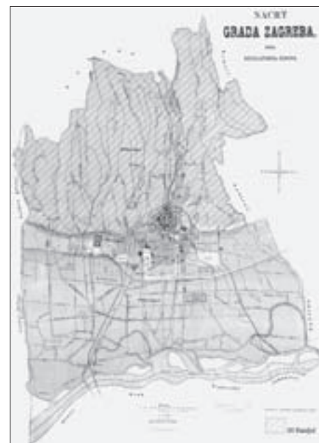
SL. 3. TREĆI RAZDJEL U URBANISTIČKOM PLANU ZAGREBA IZ 1887. GODINE, GDJE JE BILA MOGUĆA IZGRADNJA LJETNIKOVACA (ŠRAFIRANO NA KARTI) FIG. 3 THIRD PARTITION IN THE 1887 ZAGREB'S URBAN PLAN WHERE THE CONSTRUCTION OF COTTAGES WAS ALLOWED (HATCHED AREA)