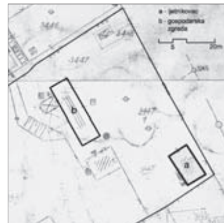
FIG. 16 COTTAGE AT 73 SREBRNJAK STREET, BUILT IN CA. 1921 – FARM BUILDINGS – CONSTITUENT PART OF THE COTTAGE COMPLEX, SECTION OF A CADASTRAL MAP FROM 1967