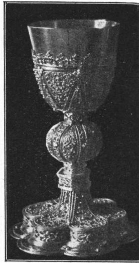
Kalež iz fratarske crkve na Trsatu, iz g. 1689.

izlazi iz njega i nosi kupu, a kupa ima oblik dugoljaste polukruglje. Ornamentat resi ne rijetko sve dijelove kaleža osim kupe. Kako se forme jedne epohe potežu ne rijetko i daleko u drugo doba, kada već postoje i drugi oblici, koji konačno prevladaju, a to je u zlatarstvu pogotovo često — zadržavali su se ovi najstariji oblici dijelom i u mnogo kasnijim tvorevinama. Zato se još i kasnije izrađuju kaleži sa okruglim podnoškom, kad je već gotika uzmakla sasvim pred drugim formama.