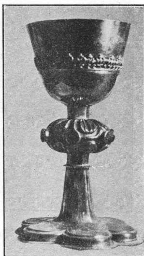
Raniji gotski kalež iz Djakova. — Kalež kapele Sv. Martina pod Loborom, iz g. 1612.