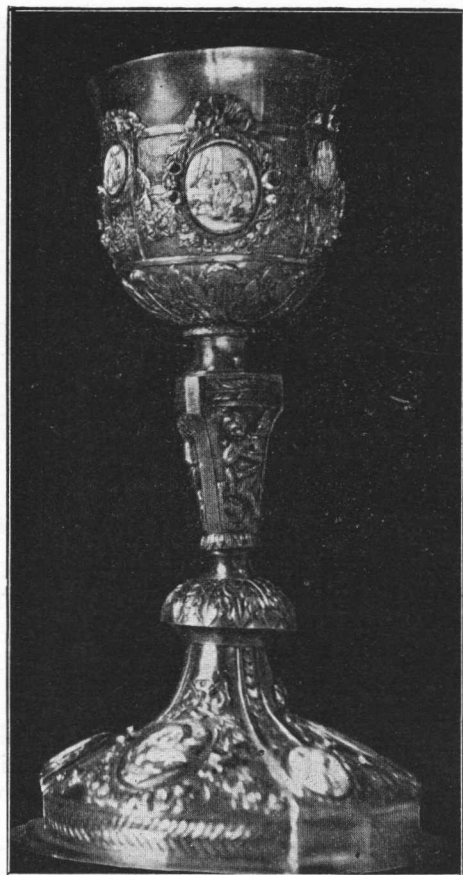
Kalež župne crkve u Voći, iz kraja XVIII. stoljeća.

obodom, u silhouetti isprevijani nodus, nerazmjerno visok prema dužini, prebujna ornamentika. To su značajke kaleža, kao što su u Šarengradu u Srijemu iz g. 1756., i onaj u Mariji Taborskoj u Zagorju iz g. 1754., koji je vanredno precizno izrađen. Nego jedno valja tu uvažiti: dok su gotski kaleži uza svu raznolikost međusobno dosta blizi, ima od ovoga baroknoga tipa upravo nepregledni broj varijanata, koje su izrađivane kroz cijelo XVIII. stoljeće, pa i dalje. Gotske forme iščezle su sada posvema. Tamo potkraj XVIII. i početkom XIX. stoljeća pokazuju se u nas dosta rijetke forme, kakovu nam pokazuje slika kaleža u Voći u Zagorju. To je vrlo lijep kalež: podnožak s visokim obodom; oduljena polukruglja rastavlja nodus od stalka. Sve je nekako otegnuto, sve je pokrito ornamentima: cvijećem, figuricama, emailskim medaljonima. Rekoh, da su takvi kaleži u nas dosta rijetki, jer je prijašnje doba satvorilo tako ustaljene forme, koje su se još u kasnijim decenijama proizvodale. Zato i nalazimo u svim crkvama, koje su u nas sagrađene tek g. 1780., i poslije, ponajviše kaleže učinjene malone u istim oblicima, kao što su bili i 50 godina prije.