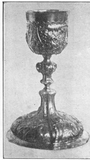
Barokni kalež crkve u Šaren- gradu u Srijemu, iz g. 1756.

rubna pločica. Nodus je stisnuta jabuka, urešen primitivnim ornamentom i sa šest komada dragog kamenja; kupa je u kotarici, koja na rubu ima vijenac stilizovanoga krina. Taj ornament ima gotovo svaki gotski kalež sve do baroknoga doba. Prispodobivši ga s prvim kaležem, vidimo sasvim drukčije razmjere: podnožak prema kupi znatno manji, stalak vitkiji, nodus nešto prevelik.