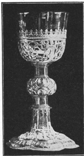
Kalež župne crkve u Tuhlju, iz g. 1616.