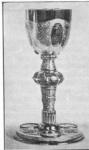
Moderni kalež, izradio Leopold Forstner, Wien. Materijal: drage kovine, kamenje i emajl.