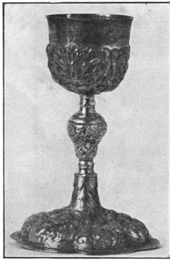
Barokni kalež u muzeju za umjetnost i u. obrt u Zagrebu, iz g. 1689.