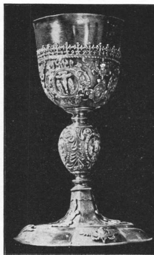
Kalež župne crkve u Hrašćini, iz g. 1680.

Naumio sam u nizu prikaza predočiti ono, što smo po našim malim crkvama našli: ne marim za riznice sa divot komadima. Prikazat ću tek pojedine tipične komade iz naših seoskih crkava. One su doduše većinom tuđinskoga porijetla, ali se ipak moraju smatrati našim dobrom; generacije su ih upotrebljavale, čuvale i dalje predavale. U malim zabitnim kapelicama nalazimo i danas još prekrasnih komada, a sve u svemu, sačuvalo se dosta toga, ma da su vješti trgovci znali ovdje ondje izmamiti koji stari komad „za dva nova“!