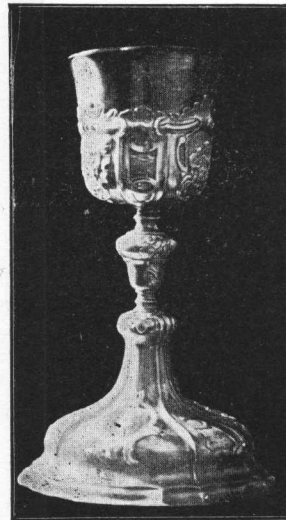
Kalež iz crkve Marije Taborske u Zagorju, iz g. 1754.

Kad je polovicom XVIII. stoljeća već profinjeni barok posvema zavladao svijetom, počeli su nemirnim baroknim ornamentom i kaleže dekorirati. I forma je postala drugojačija: širok podnožak često sa veoma širokim