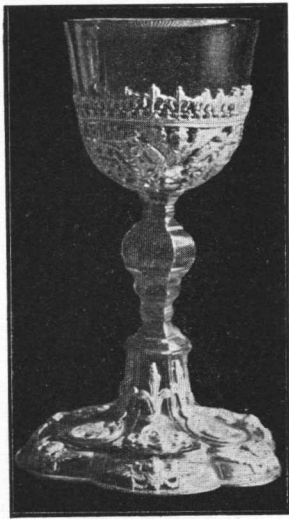
Kalež župne crkve u Glogovnici, iz g. 1656.