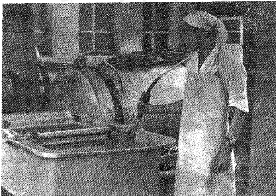
Sl. 3 — Mjerenje dopremljenog mlijeka s Hauptner mjernim kabelom s elektrodom 2 signalne lampe u prijemnom bazenu na peronu Zagrebačke mljekare.

pH mlijeka može se odrediti kolorimetrijskim ili elektrometrijskim putem. Elektrometrijski se najbolje određuje s pomoću elektroda koje mogu biti: vodikova, kalomel, kinhidron elektroda. Prema tome kojoj vrsti je pH sprava namijenjena (za kontrolu prijema mlijeka na peronu, laboratorij, upravljanje, itd.) izrađene su i tome prikladne elektrode.