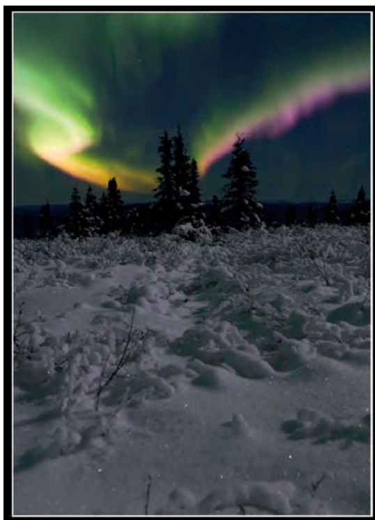
Slika 6. Jedna od fotografija polarne svjetlosti iznad Aljaske.

Figure 5. Past and future cycle of sunspots according to www.smeter.net/.../sunspot-cycle-forecasts.php (red are forecasted curves of oncoming cycles according to two forecasters).