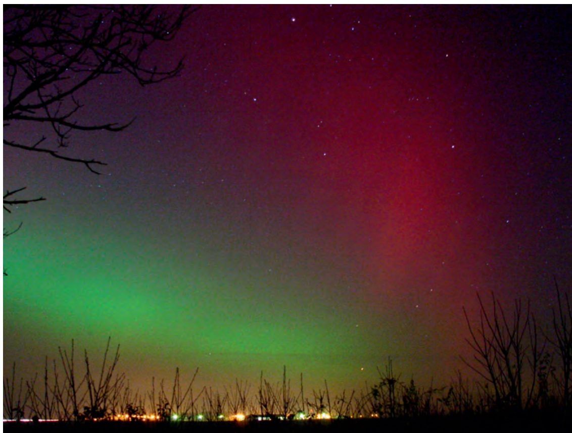
Slika 3. Prva fotografija polarne svjetlosti, videne 7. travnja 2000. g. iz istočne Hrvatske, snimio Milan Karakaš (Cerić, Vinkovci, izbor od 161 fotografije snimljene u vremenu 17:30 do 21:30).

Figure 3. First photo of polar light, seen on April the 7 th , 2000 from eastern Croatia, photo taken by Milan Karakaš, (Cerić, Vinkovci, selected from 161 photos taken from 17 30 till 21 30).