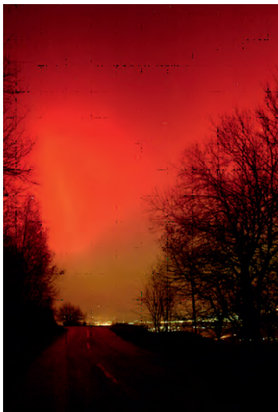
Slika 4. Polarna svjetlost videna sa Sljemena na Medvednici, kraj Zagreba, snimio Hrvoje Horvat i ekipa.

Figure 4. Polar light seen from mountain Medvednica near Zagreb, photo taken by Hrvoje Horvat and friends.