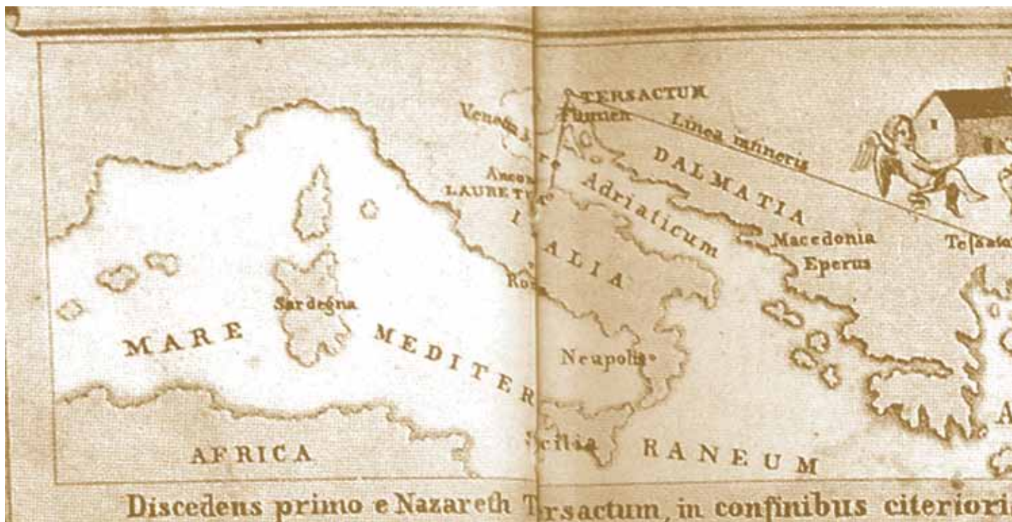
Fig. 6. Map of the transfer of the Holy House made by an unknown author, 1715 (Grimaldi, 1993)