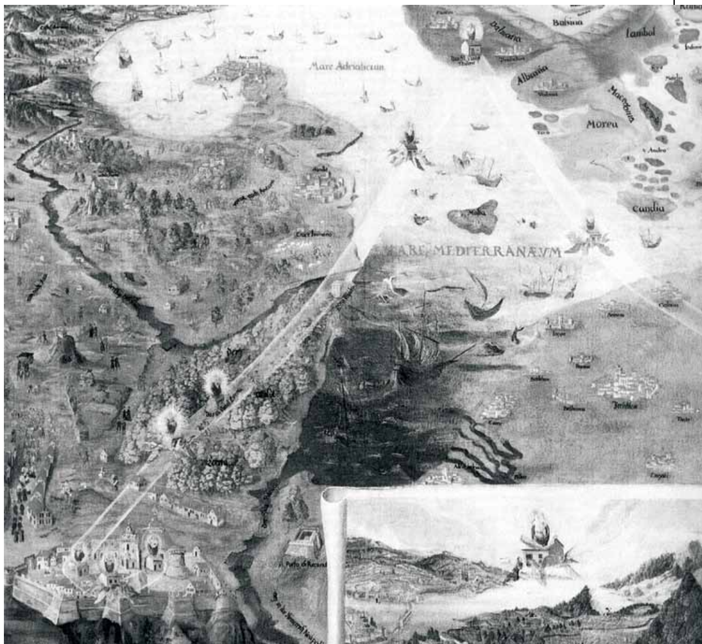
Fig. 5. Dietterlin's representation of the transfer of the Holy House, 1647 (Grimaldi, 1993)

Slika 5. Dietterlinov prikaz prijenosa Svete kuće, 1647. (Grimaldi, 1993)