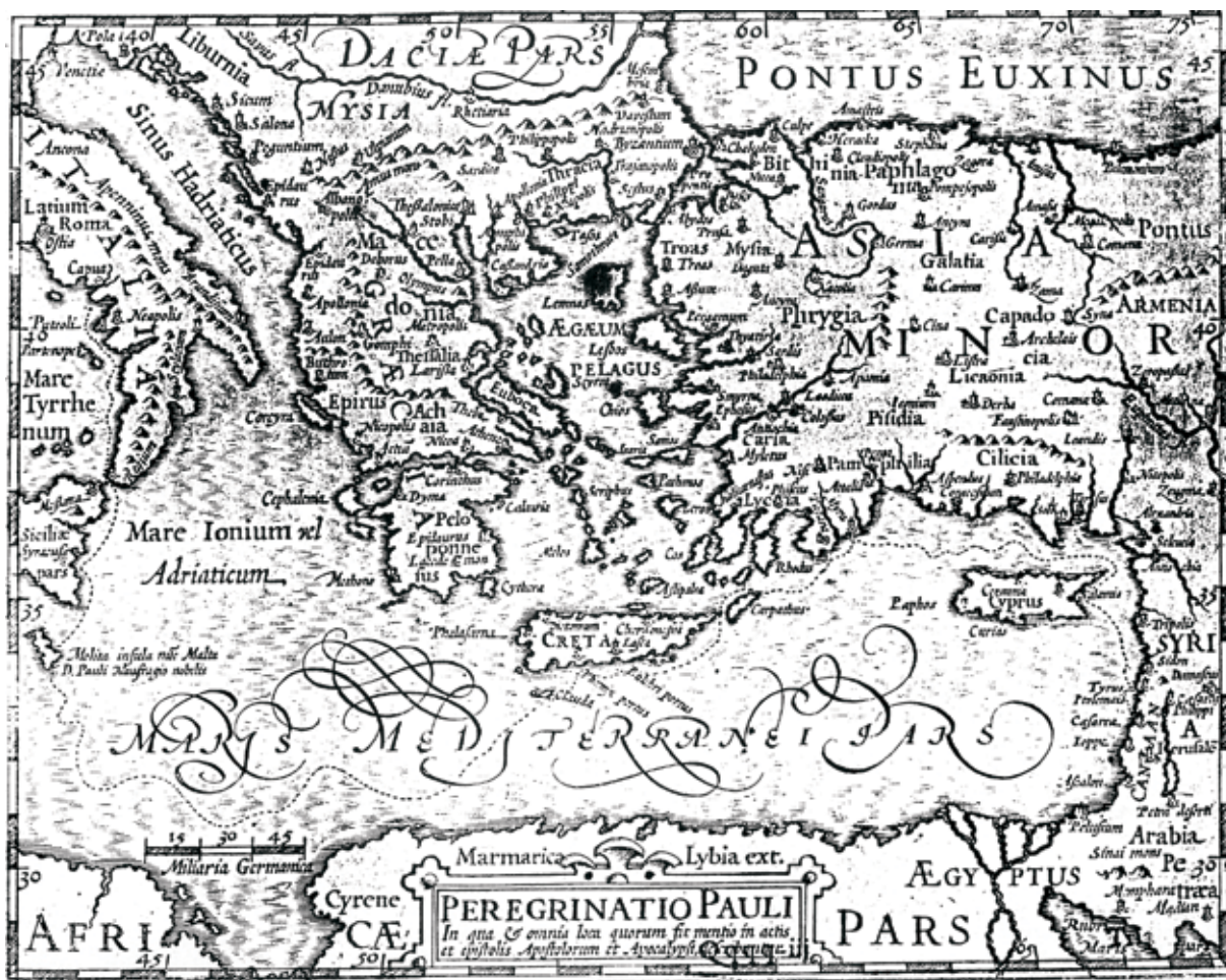
Fig. 4: Mercator's cartographic representation of the travel of St. Paul the Apostle, 1621 (Kozličić, 1995: 189)

Slika 4. Mercatorov kartografski prikaz putovanja sv. Pavla Apostola, 1621. (Kozličić, 1995: 189)