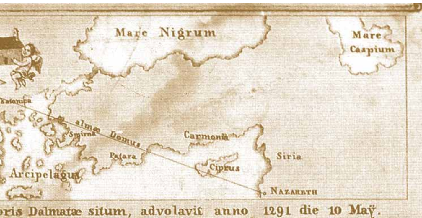
Slika 6. Karta prijenosa Svete kuće nepoznatog autora, 1715. (Grimaldi, 1993)

godina poslije, kada je Robert Dudley priredio zbirku karata Arcano del mare (1661.), u kojoj su prvi put sve pomorske karte izrađene u Mercatorovoj projekciji (Moreland, Bannister, 1995).