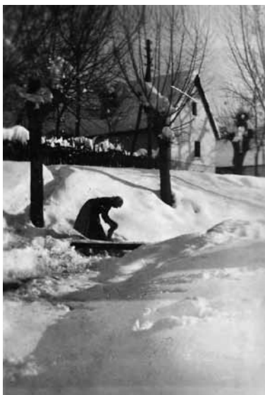
Slika 1. Bistrica, privatni posjed obitelji I. Friščića

Sjeverni obronci Ivanšćice, nastale složenim geomorfološkim razvojem, predstavljali su pogodan prostor za naseljavanje u novom valu seoba na kraju VI. i početkom VII. stoljeća. Novim je stanovnicima geografski položaj prostora, apsolutne visine, njegov reljef i tlo bio posebno zanimljiv radi sigurnog brežuljkastog terena koji je predstavljao važnu stratešku poziciju, ali i sigurnost od iznenadnih poplava. Izvori pitke vode (Bistrica), plodno tlo pogodno za obradu i prirodna bogatstva (posebice šuma) doprinijeli su tako ranom naseljavanju i stvaranju naselja te njegovom daljnjem rastu i razvoju u trgovište tijekom srednjeg vijeka s presudnim utjecajem reda ivanovaca.