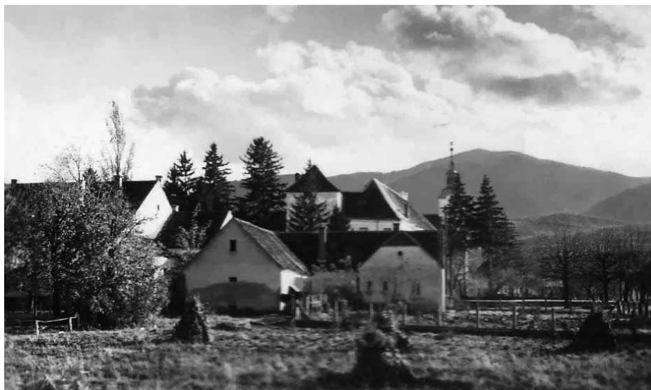
Slika 2. Ivanec, 30. godine XX. stoljeća, privatni posjed obitelji I. Friščića

Na samom ivanečkom trgu bile su dvije građevine (jedna je bila trgovca Leitnera), dok je lijevo od njih, dalje na sjever, bila samo staza u polju prema lokaciji gdje će kasnije biti izgrađena željeznička pruga. S druge strane trga nalazila se gostionica i prenoćište nasuprot koje je bio Kukuljevićev grad. Lijevo od grada nalazio se fotograf što smatram posebnom zanimljivošću važnom za stalno prisutan interes stanovnika Ivanca za fotografiju. Podalje, na cesti za Varaždin bila je djevojačka škola časnih sestara milosrdnica. Na samom izlasku iz Ivanca smjestila se još jedna krčma. Kraj Kukuljevićevog grada (prema Ivanščici) nalazila se župna crkva, župni dvor i muška škole, a dalje su slijedile seoske kuće duž čitave prometnice s lijeve i desne strane (danas najduža ivanečka Rajterova ulica) završavajući na kraju pilanom prije Prigorca.