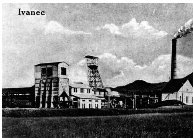
Ivanečki rudnik lignita oko 1920.