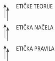
Slika 1. Etičke prosudbe

Etika je teorija ili filozofsko promišljanje morala kao temeljnog načina ljudskog odnosa. Ona proučava moral kao oblik praktičnog ljudskog djelovanja. Etika utemeljuje pojam moralnosti koji je osnova morala. Dok pitanje morala glasi ŠTO TREBA ČINITI?, etičko pitanje traži odgovor na pitanje ZAŠTO TREBAM ČINITI TO ŠTO TREBAM ČINITI? Etika pokušava odgovoriti na pitanje zašto treba činiti dobro i po čemu je dobro doista dobro - ona je filozofska refleksija moralnosti ljudskog djelovanja. Činjenje dobrog a izbjegavanje činjenja zla etičko je načelo, osnovno pravilo (uputa, mjerilo, naputak, obrazac, točan popis) ponašanja a u sklopu neke etičke teorije u društvenom ponašanju. U donošenju etičkog suda, odluke ili zaključka ("etičke prosudbe") sva tri spomenuta elementa (pravila, načela, teorije) su povezana i da na prosudbu imaju stanovit utjecaj. To možemo prikazati grafički na način kako je učinjeno na slici 1. U ovom je grafičkom prikazu /25/ kao što se vidi, zastupljena induktivna metoda koja polazi od pojedinačnog (pravila) i ide ka uopćavanju (teoriji). Međutim, u etičkom prosuđivanju moguć je i obrnuti put (deduktivna metoda), da se prosudba temelji na nekoj etičkoj teoriji (deontološkoj, militarističkoj, egzistencijalističkoj, stoičkoj itd.) i preko određenog etičkog načela vodi ka konkretnom etičkom pravilu (na primjer, ne kažnjavaj učenika).