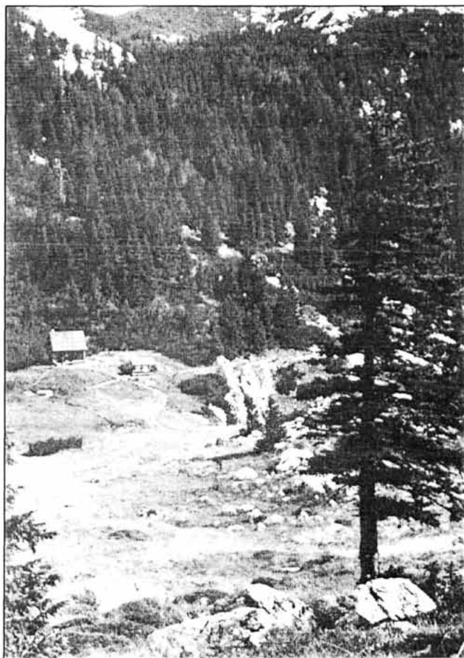
Sl. 1. Velebitski botanički vrt uređen u Modrić-docu pod V. Zavižanom, snimljeno od prijevoja pod Domom, oko 1970.

Najveće zasluge za osnivanje Vrta pripadaju prof. F. Kušanu, koji je s pravom smatrao da će "Vrt u prvom redu služiti upoznavanju flore i vegetacije Velebita, i to ne samo u svrhu populariziranja naše flore uopće nego i za znanstvena istraživanja. Osobita će se pozornost posvetiti ispitivanju životnih zahtjeva rijetkih i ugroženih biljaka, s kojima će se i najviše eksperimentirati." Punu potporu osnutku i radu Vrta dali su Farmaceutsko-biokemijski fakultet i Republički zavod za zaštitu prirode, te posebno Šumsko gospodarstvo Senj i Šumarija Krasno u osiguranju sredstava i izvođenju radova.