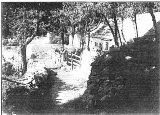
Sl. 3. Babrovača, stari planinski stan obitelji Vukušića – Gornja Klada, rujan 2002.

U sklopu "Dana Velebitskog botaničkog vrta" predstavljeni su dječji radovi koji su nastali u radionici za najmlađe pod nazivom "Crtajmo velebitsko bilje". Istodobno, predstavljena je u Planinarskom domu "Zavižan" izložba fotografija "Velebit te (se) zove(m)" autora Branimira Šalova iz Zadra. Na fotografijama većeg formata autor nam je ponovno otkrio velike ljepote Velebita kojima se opet, po tko zna koji put, iznova divimo. U Vrtu su se također mogli nabaviti plakati i razglednice posvećene "Međunarodnoj godini planina 2002", koja je posvećena zaštiti planinskih ekosustava i unapređivanju života ljudi u planinskim zajednicama. Planine osiguravaju vodu za čitavo čovječanstvo i obiluju velikom biološkom raznolikošću. Osim toga sadrže iznimno osjetljive ekosustave u kojima obitava 1/10 ljudske populacije. U Hrvatskoj se primjerice čak 10 zaštićenih područja nalazi u planinskom području. Svečanosti u Vrtu prisutni su bili predstavnici vlasti grada Senja na čelu s gradonačelnikom Milanom Devčićem, dipl. ing. šum. i Darkom Fekežom, dipl. ing. šum. predsjednikom Gradskog vijeća. Naime, odmah nakon završetka proslave snimljena je prigodna kazeta. Majstor kamere bio je Ante Španić, snimatelj iz Senja, a režiser i pisac teksta dr. sc. Vice Ivančević, dok je tehnička obrada bila povjerena IRS studiju iz Kastva.