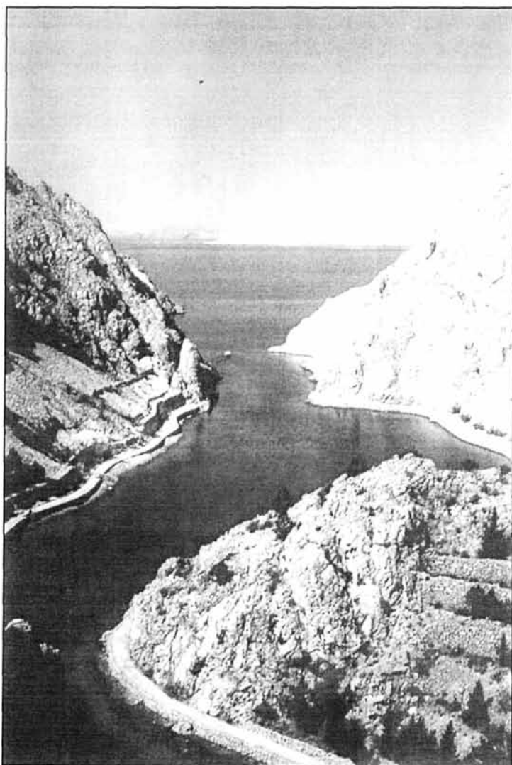
Sl. 2. Slikovita drāga Zavratinica južno kod Jablanca

kraja drage, a možda se zaputiti i do suprotne strane i tada se plivajući vratiti prema stazi kojom smo došli.