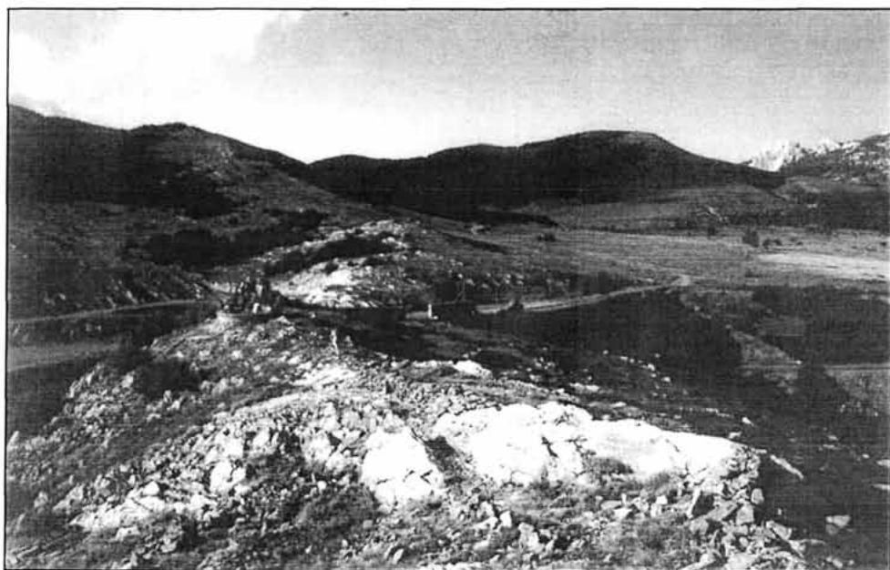
Sl. 3. Krš na rubu Baških Oštarija, stara Vrata i prijevoj Kubus