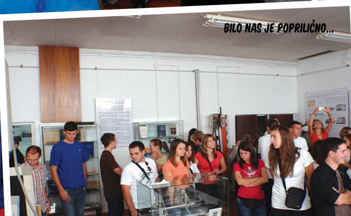
BILO NAS JE POPRILIČNO...