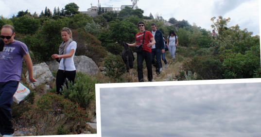
AHA...TO JE TAJ KOZJI PUTELJAK