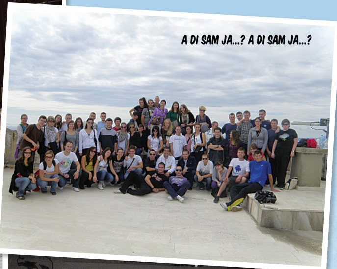
A DI SAM JA...? A DI SAM JA...?

Grad Hvar jedinstven je spoj raskošne mediteranske prirode, bogate i slojevite kulturno-povijesne baštine, te mondene turističke suvremenosti. Smješten u slikovitom