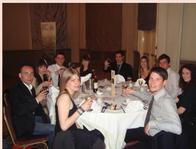
SLIKA 5. Svečana večera

Nakon toga je bila ceremonija otvorenja, te General assembly – ključni dio susreta, na kojem smo prezentirali sve prihode i rashode prošlogodišnjeg IGSM-a (slika 1). Taj izvještaj je bio prihvaćen u cijelosti.