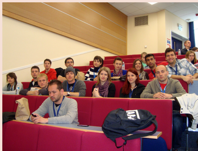
SLIKA 3. Naši studenti na predavanjima