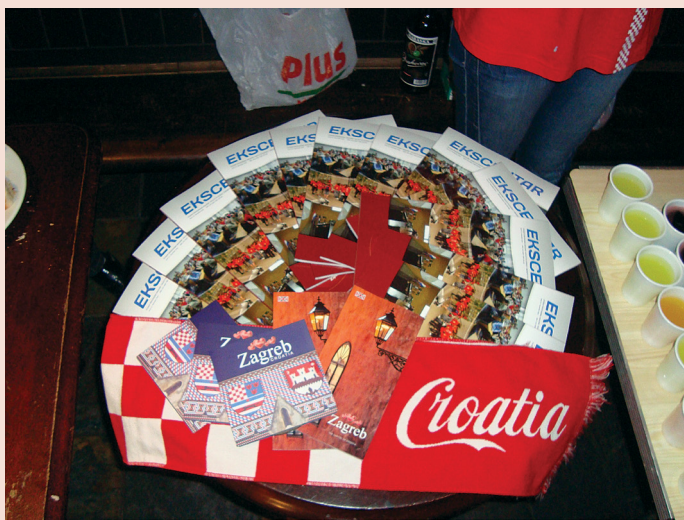
SLIKA 2. Hrvatski stol na nacionalnoj večeri